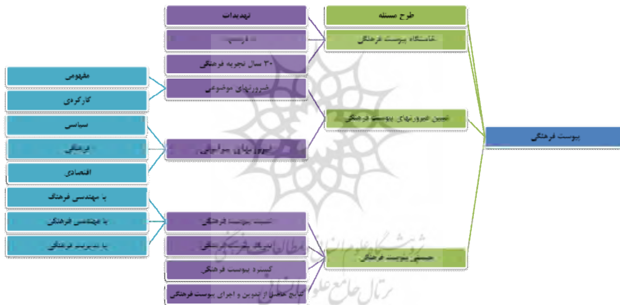
شکل ۳. تحلیل پیوست فرهنگی