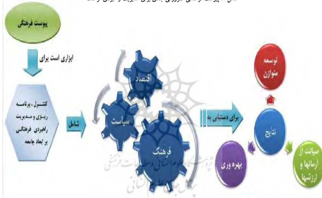
شکل ۱. پیوست فرهنگی ضرورتی جدی برای مدیریت راهبردی فرهنگ