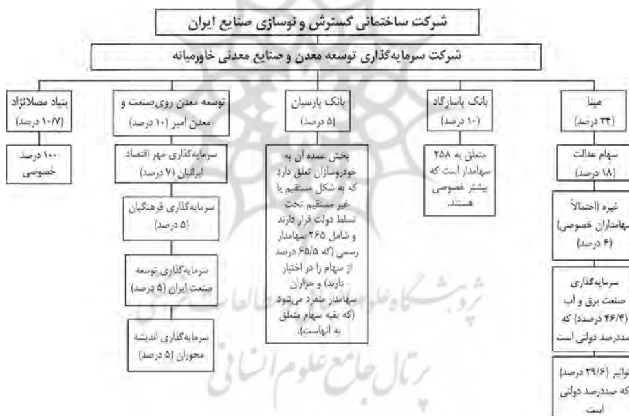
شکل ۲: فرایند شناسایی ساختار مالکیت هر خریدار

برای بررسی این مورد از معیار «سهام مدیریتی» استفاده شد که نشان می‌دهد کدام یک از مالکان از حق انتخاب هیئت مدیره و اداره شرکت برخوردارند. یکی از روش‌های بررسی نفوذ بخش عمومی در نظام اقتصاد بازار همین روش است. اگر داده‌ها این فرضیه را تأیید کنند نه تنها می‌توان دریافت که نفوذ بخش عمومی در شرکت‌ها در خلال خصوصی‌سازی، کم نشده، بلکه می‌توان نتیجه گرفت که بخش خصوصی به تدریج از طریق خصوصی‌سازی به سهامدار بخش عمومی تبدیل شده است.