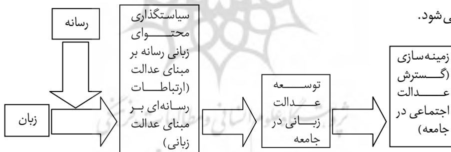
نگاره ۲: الگوی رفتار رسانه زمینه ساز

به منظور توسعه عدالت زبانی از طریق رسانه باید سیاست گذاری و برنامه ریزی زبانی لازم برای تقویت گفتمان های عدالت محور در رسانه صورت گیرد، به گونه ای که هر نوع محتوای زبانی یعنی هر نوع به کارگیری زبان در رسانه، براساس عدالت و به دور از هرگونه سلطه و تبعیض، تحمیق و افترا باشد. به یک معنا، اخلاق رسانه ای با رویکرد عدالت گرایانه مبنای هرگونه محتوای زبانی رسانه قرار گیرد. چنین رویکردی، سرانجام به توسعه فرهنگ عدالت خواهی، عدالت پذیری و عدالت گستری در جوامع منجر خواهد شد و از دل این فرهنگ، تحقق دیگر ابعاد عدالت اجتماعی در جامعه مطالبه و به تدریج، بستر تحقق آن فراهم می شود.