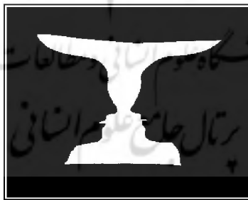
شکل ۱: گلدان-نیم‌رخ رابین (۱۹۱۵)