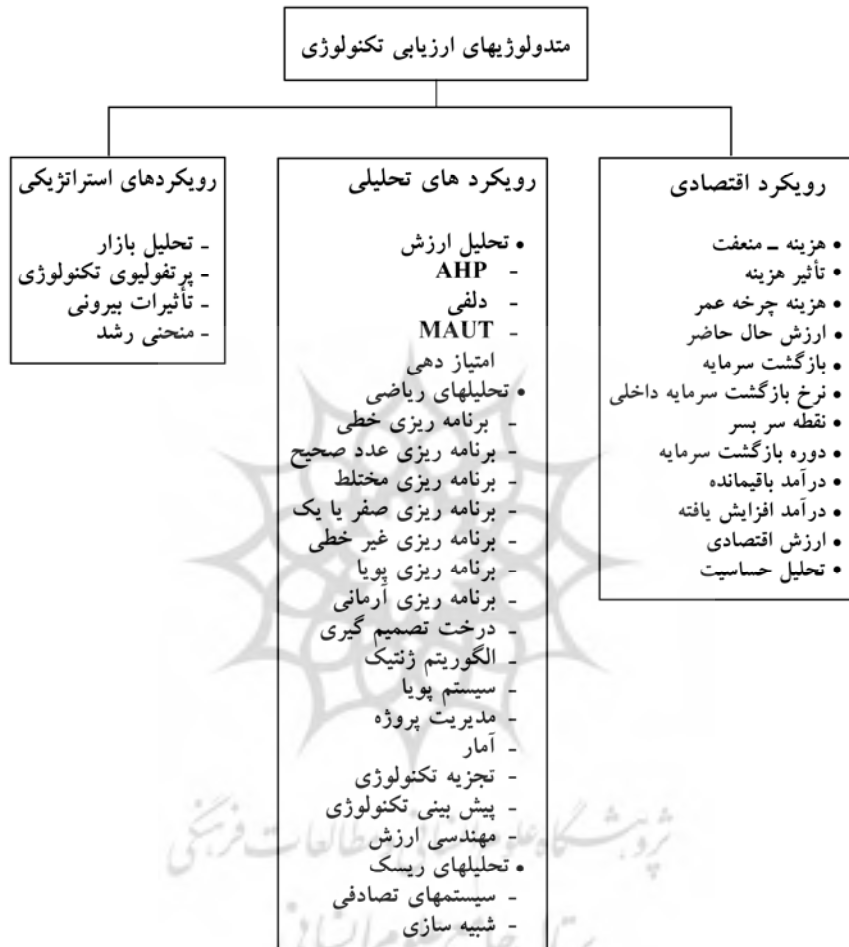
شکل ۱. روشهای موجود در انتخاب فن آوری (مردیت و سورش، ۱۹۸۶: کرافورد و بنه دتو، ۲۰۰۸)