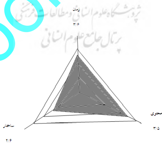
شکل ۲: نظرات کارکنان در مورد ابعاد سه‌گانه‌ی سیستم اطلاعاتی