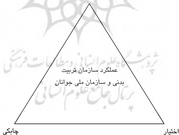
نمودار ۲ سه‌گانه عملکرد وزارت ورزش و امور جوانان