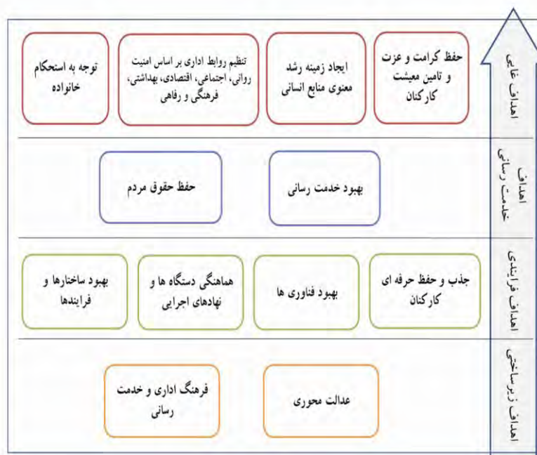
شکل ۱. نقشه اهداف استراتژیک سیاست‌های کلی نظام اداری

وزن دهی به هدف‌ها. الگوی فرایند تحلیل سلسله مراتبی ۱ (AHP). پس از دریافت نظرات متخصصین پیرامون مضامین استراتژیک اجرای سیاست‌های کلی نظام اداری و همچنین پیرامون نقشه اهداف استراتژیک استخراج شده از درون این مضامین، پرسشنامه دیگری در اختیار متخصصین قرار گرفت که در آن خواسته شده بود که وزن هر یک از ابعاد و اهداف را با استفاده از تکنیک فرایند تحلیل سلسله مراتبی و از طریق مقایسات زوجی مشخص کنند. فرایند تحلیل سلسله مراتبی یکی از روش‌های تصمیم‌گیری است. علت سلسله مراتبی خواندن این روش آن است که ابتدا باید از اهداف و استراتژی‌های سازمان در راس هرم شروع کرد و با گسترش آن‌ها معیارها را شناسایی کرد تا به پایین هرم برسیم. اساس این روش تصمیم‌گیری بر مقایسات زوجی ۲ نهفته است. تصمیم‌گیری با فراهم آوردن درخت سلسله مراتب تصمیم آغاز می‌شود. درخت سلسله مراتب تصمیم، عوامل مورد مقایسه و گزینه‌های رقیب مورد ارزیابی در تصمیم را نشان می‌دهد. سپس یک سری مقایسات زوجی انجام می‌گیرد. این مقایسات وزن هر یک از عوامل را در راستای گزینه‌های رقیب مشخص می‌سازد. در نهایت منطق AHP به گونه‌ای ماتریس‌های حاصل از مقایسات زوجی را با همدیگر تلفیق می‌سازد که