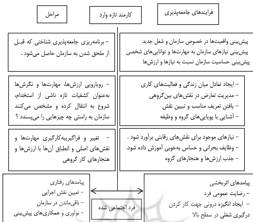
شکل ۱. الگوی جامعه‌پذیری سازمانی

در پژوهشی که کلن و همکارانش (۲۰۰۶) در مورد جامعه‌پذیری انجام دادند، به این نتیجه رسیدند که تأثیر غیرمستقیم تجربه‌ها و دانش افراد در مورد سازمان پیش از ورود به آن، به واسطه عواملی مانند ارزش‌ها، سیاست‌ها و تاریخچه سازمان بر جامعه‌پذیری‌شان، بیشتر از تأثیر مستقیم این دو متغیر بر هم است و نقش میانجی‌گری ارزش‌ها، سیاست‌ها و تاریخچه سازمان را اثبات کردند [۱۳]. اما در این پژوهش سنوات کاری و ارشدیت کارکنان به‌دلیل اینکه متغیری فردی است و در آشناسازی کارکنان با سازمان و ویژگی‌های آن می‌تواند مؤثر باشد، به‌گونه‌ای که با افزایش سنوات کاری میزان آگاهی و شناخت کارکنان از رویه‌ها و خط‌مشی‌های سازمانی افزایش می‌یابد و می‌توان آن را به‌عنوان متغیر مستقل ثانوی در نظر گرفت، به‌عنوان متغیر تعدیل‌گر در نظر گرفته شد.