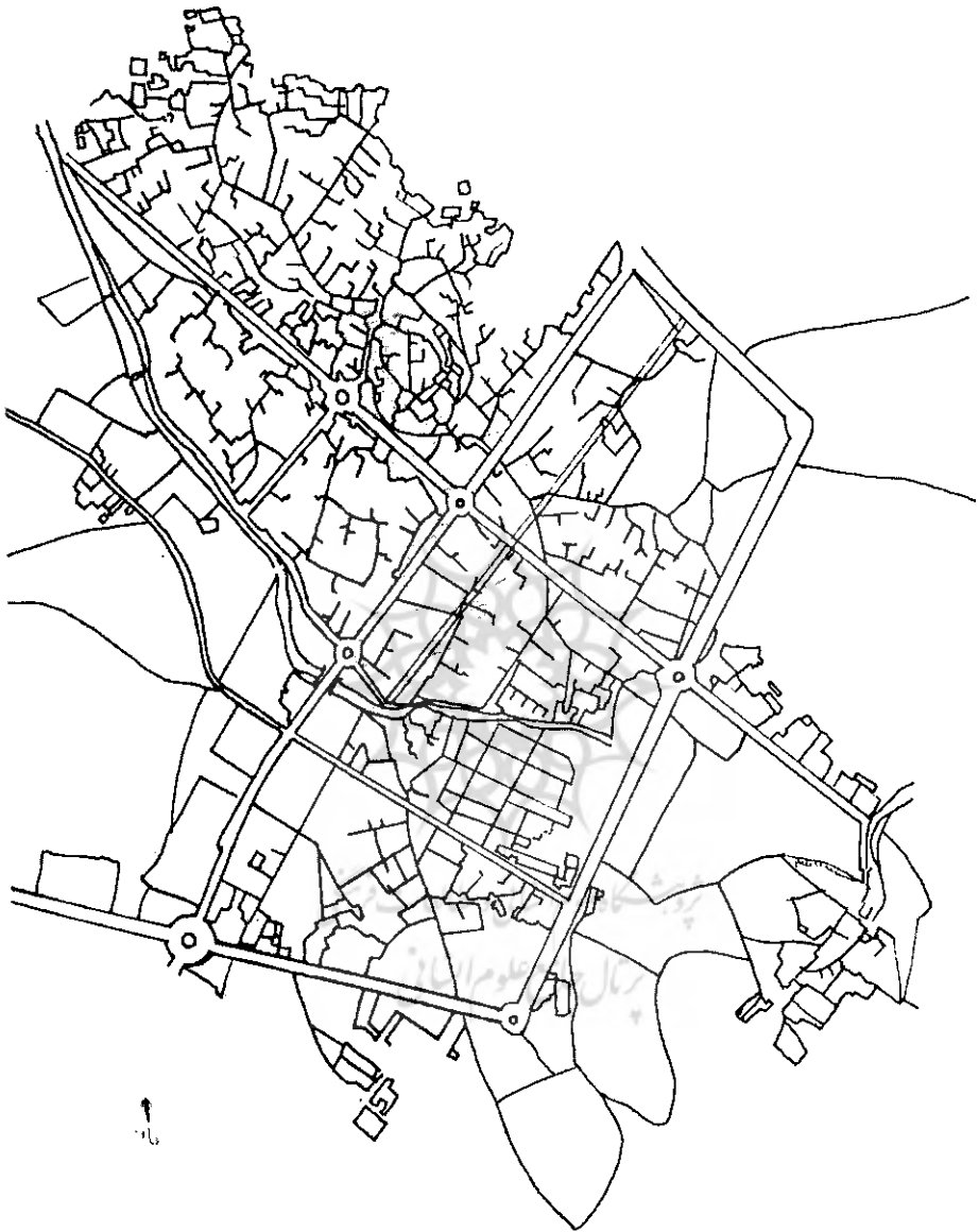
نقشه‌ی بافت قدیم شهر نهاوند - محدوده‌ی مرکزی با هاشور مشخص شده است.