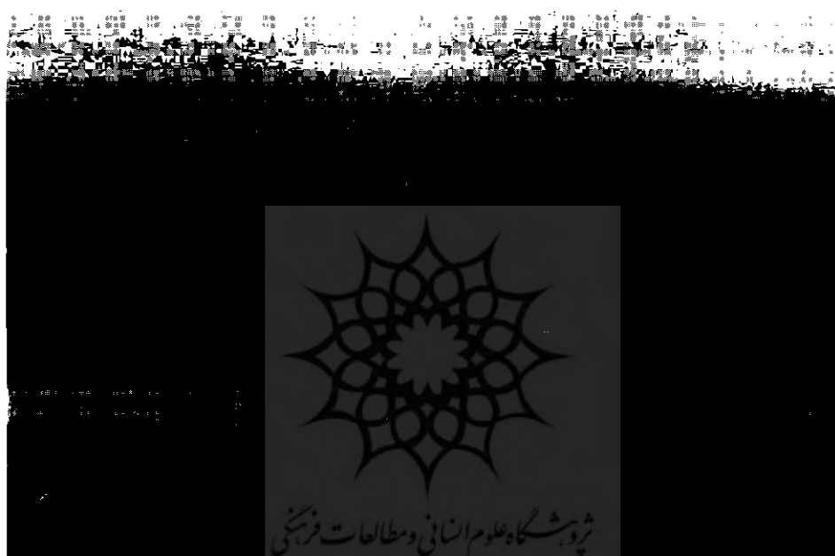
تصویر قسمتی از شهر تخریب شده‌ی لائودیسه

۲۰- شهر لائودیسه که قبل از معبد لائودیسه احداث گردیده در همان حوالی شناسایی شده است. این شهر محل سکونت اولیه‌ی دست‌اندرکاران ساخت معبد لائودیسه بوده و بعد از آن، محل استراحت خدّمه‌ی معبد شده است.