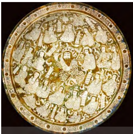
تصویر ۳- بشقاب زرین فام، کاشان، سده ۶ و ۷ قمری

راه یافتن هنر به میان مردم، پدیده‌ای دیگر را نیز به همراه داشت و آن تصویرسازی وقایع زندگی مردم کوچه و بازار بود که پیش از این در فرهنگ تصویری ایران بی‌سابقه بود. پژوهشگران، یکی از ویژگی‌های مهم آثار استاد کمال‌الدین بهزاد - سده نهم قمری را پرداختن به زندگی روزمره‌ی مردم عادی و تصویرگر افراد غیردرباری و غیرشاخص؛ بیان کرده و وی را مبدع این روش در نگارگری ایرانی معرفی می‌نمایند. ۱ با بررسی سفال‌های زرین فام سده ششم ه. ق، این نکته آشکار می‌گردد که پیش از استاد بهزاد، مضمون واقع‌گرایی وارد عرصه نگارگری شده و آثاری نیز خلق گردیده است. در این سفال‌ها نوعی برداشت مردم نگارانه، جایگزین تصویرسازی از جهانی خیالی می‌گردد. بشقاب‌هایی که نشانگر تصویر یک مکتب‌خانه با تمامی جزئیات آن (تصویر ۲)، ساربان‌ها با شتر (تصویر ۳) و یا یک کاشی که دعوایی معمولی در کوچه و بازار را نمایش می‌دهد (تصاویر ۴ و ۵) نمونه‌هایی از این فرگشت می‌باشند.