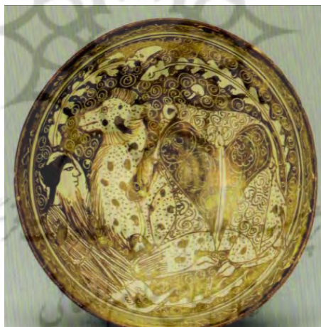
تصویر ۲- بشقاب زرین‌فام، با نقش لیلی و مجنون در مکتب‌خانه، انستیتو هنری شیکاگو ۲ ری، اواخر سده ششم قمری، مجموعه داوید، کپنهاگ ۳

سفالین بودند؛ در حالی که نگاره‌های کتب مصور یا نقاشی‌های دیواری به سلاطین و بلندپایگان اختصاص داشت. اگر ظروف زرین‌فام در اختیار طبقه خاصی بودند و قاطبه مردم از دیدن نقوش شگرف این سفال‌ها محروم بودند، کاشی‌ها این رسالت را به خوبی انجام دادند تا عامه مردم را با این نقوش آشنا سازند. کاشی‌های زرین فام که اولین نمونه کاشی‌های نفیس مصور بودند، برای نخستین بار در اماکن مذهبی مانند مساجد و امام زادگان در معرض دید همگان قرار گرفتند. در همین زمان است که نگارگری ایرانی تبدیل به «هنر مردمی» شده و از هنر اشرافی و خاص درباری فاصله می‌گیرد. هنر مردمی، هنر راستین و ژرف عامه است که نشان دهنده‌ی زندگی روزمره می‌باشد. هنر عوام، اساساً واقع‌گرای است، ۱ و چندان به تغییرات سیاسی، اجتماعی و اقتصادی وابسته نبوده و با افکار عمومی ارتباط دارد. ولی در هنر اشرافی چون هنرمند، به ناچار تابع سلیقه خریداران و پشتیبانان یعنی فرمانروایان و بلندپایگان بود، هنرها نیز تابع تغییرات سیاسی آن دوره می‌شدند.