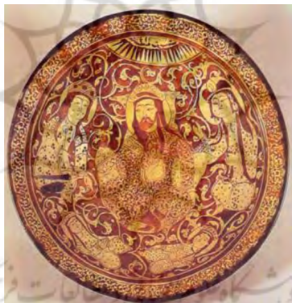
تصویر ۶ - بشقاب زرین فام، کاشان، اوایل قرن هفتم هجری، موزه اشمولین، آکسفورد .

واقعیت را موافق حال خود می‌بیند و با اشتیاق به واقعیت می‌نگرد و به نظام عینی جامعه و طبیعت دل می‌بندد. پس اندیشه در این دوره بیش از دوره‌های دیگر بر واقعیت منطبق است. در اروپای دوره رنسانس نیز با ترقی طبقه سوداگر، هنری واقع‌گرا ایجاد شد. در این‌گونه شرایط که طبقه نو می‌خواهد بر طبقه کهنه غلبه کند، مردم عادی را به همکاری می‌خواند و آنان هم که اصلاح‌طلبی طبقه نو را به سود خود می‌یابند؛ همکاری با آن را می‌پذیرند. در جریان این سازش، طبقه نو با اشتیاق، به فرهنگ عوام رو می‌کند و با واقع‌گرایی دیرین عوام، واقع‌گرایی نویناد خود را نیرو می‌بخشد. بنابراین هنر عوام، صاحب اعتبار می‌شود. ۱ به عنوان مثال، در اروپای اواسط قرن شانزدهم م. / دهم ق نیز بر اثر تحولات اجتماعی، ذوق عوام در هنر رسمی راه یافت. ۲ این فرآیند به درستی مشابه فرگشتی است که در زمان سلجوقیان رخ داد و هنر واقع‌گرایانه این دوره را ایجاد نمود.