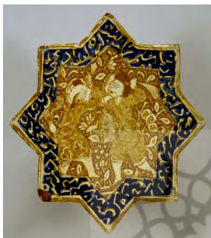
تصویر ۴- کاشی ستاره‌ای زرین فام، کاشان، اواخر سده ششم هـ. ق. مجموعه هنری والترز.

این بازتابی زندگی روزمره و توجه به مردم معمولی، نشان‌دهنده گسترش شهرنشینی، افزایش جمعیت شهرها، رشد بورژوازی، گسترش صنعتگری و رشد سرمایه‌داری صنعتی در ایران آن روزگار است.