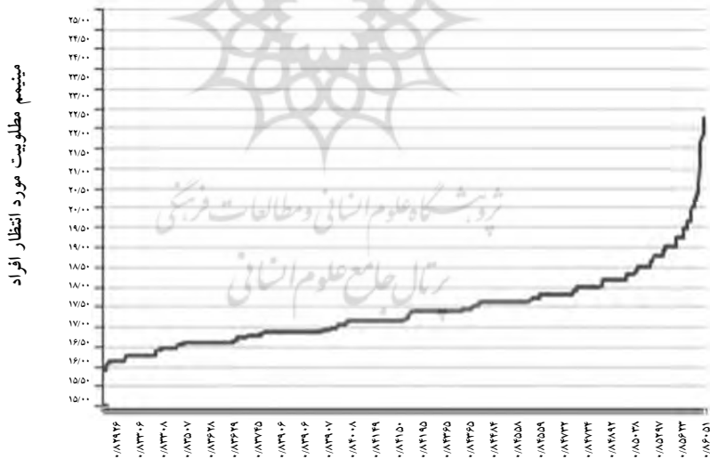
درجه ریسک گریزی