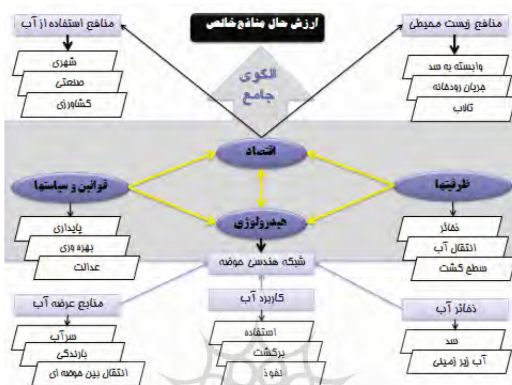
شکل ۱- عملکرد الگوی یکپارچه اقتصادی-هیدرولوژیکی حوضه رودخانه