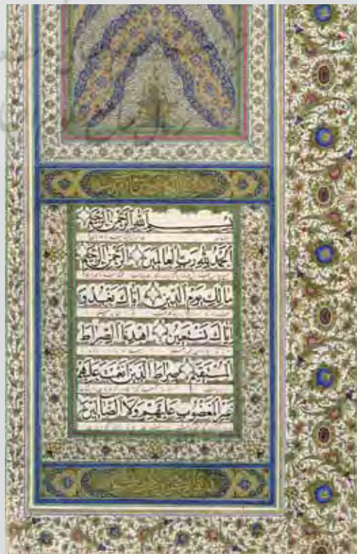
نام کتاب: قرآن نام کاتب: محمد شفیع ابن علی عسکر ارسنجانی تاریخ کتابت: ۱۳۱۵ هـ.ق اندازه کتاب: ۲۸×۴۳ جدول کتابت: ۳۲×۱۸ تعداد سطور: ۱۲ نوع خط: نسخ ممتاز تعداد صفحات: ۷۱۸ کتابت ترجمه: نستعلیق ممتاز ترجمه به خط: علی نقی شیرازی

مرحوم ملک از ابتدای عمر به مطالعه و جمع‌آوری