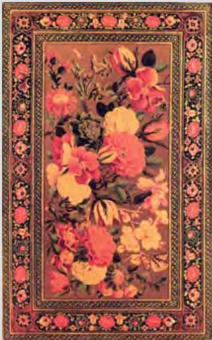
جلد لاکه نقاشی (نگاره گل و پروانه - داخل جلد: حلکاری گل و برگ) پدیدآورنده: حسین (یا ابا عبدالله) ۱۲۶۸ هجری قمری ۱۶۰×۲۶۰ میلی‌متر ۵۱-۶ ع