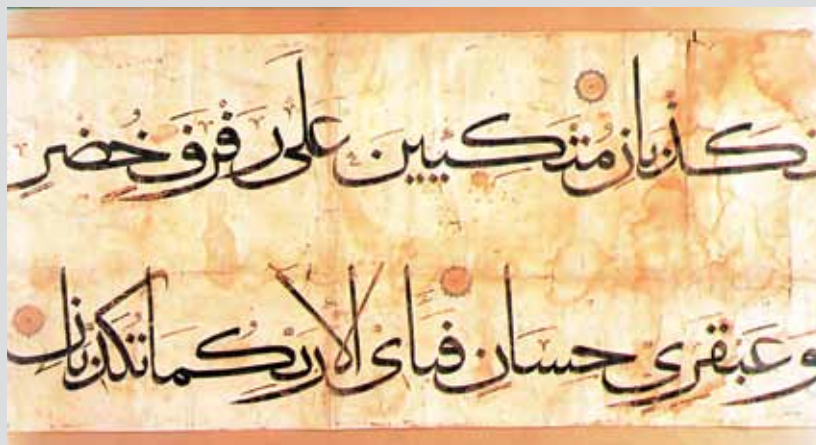
قطعه خوشنویسی قسمتی از قرآن مجید بایسنقر میرزا