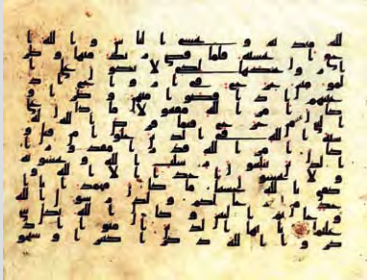
برگی از قرآن آیات ۳۷ الی ۵۰ سوره مبارکه احزاب خط کوفی (نوشته شده بر پوست آهو) قرن ۳ و ۴ هجری قمری ۱۸۲×۲۳۳ میلی‌متر

دانش‌پژوه و ایرج افشار آن را در ده مجلد فهرست‌نویسی کرده‌اند و نسخه‌های ویژه هنری هر کدام می‌تواند مبنای یک بحث جامع هنری باشد.