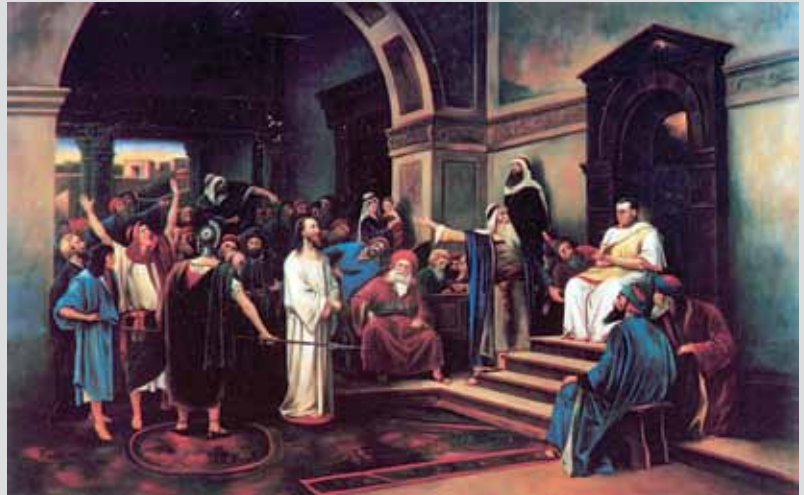
رنگ و روغن اثر هالاف

اختصاص یافته که در نوع خود دیدنی است. مجموعه کتابخانه و موزه ملک دارای محیطی جذاب و برگرفته از میراث فرهنگی و معماری ایرانی - اسلامی است؛ به طوری که قرار گرفتن در فضا تأثیر مطلوبی بر بیننده دارد و نگرش مثبتی در او به وجود می آورد. بر این اساس، بازدید از این مجموعه برای دانش آموزان، دانشجویان هنر، معلمان و دبیران و مدرسان رشته های هنری و هنرمندان تجسمی فرصتی است که روح و ذوق خویش را تلطیف کنند و گزیده ای ارزنده از هنر ایران و جهان را به تماشا بنشینند.