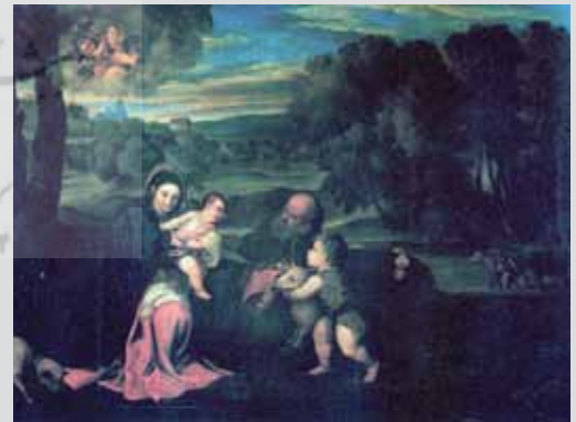
رنگ و روغن اثر کمال‌الملک