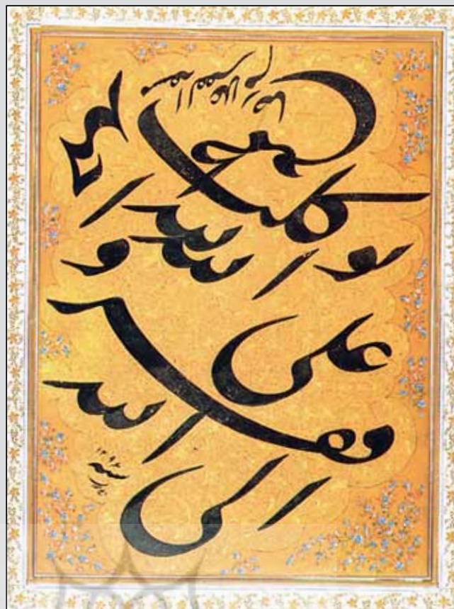
نمونه‌ای از قطعات قدیمی موزه ملک اثر میرزا غلامرضا اصفهانی