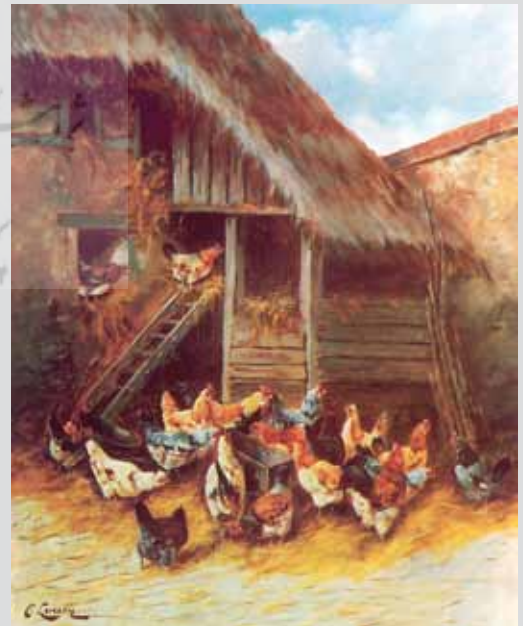
رنگ و روغن اثر لورین