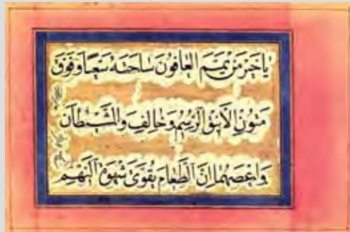
قطعه خوشنویسی قصیده برده بوصیری خط نسخ دفتری (شیوه ایرانی) خوشنویس: محمدالحسینی ۱۱۹۶ هجری قمری ۱۹۰×۲۷۰ میلی‌متری ۲۹-۱۰ ع

کتاب علاقه‌مند بود و این عشق و علاقه را تا آخر عمر حفظ کرد و این خود مقدمه‌ای برای تأسیس و تکوین تدریجی کتابخانه گران قدری شد که امروزه شهرت جهانی دارد.