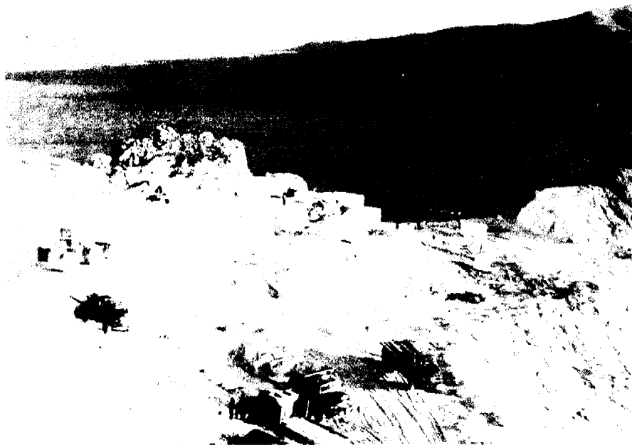
جدول استخراج معادن گروه مصالح ساختمانی سال ۷۵ و مقایسه آن با سال ۷۴

۸۸/۵ درصد عملکرد شرکتهای تعاونی معدنی مربوط به معادن گروه مصالح ساختمانی می باشد. همچنین ۲۵/۸ درصد تولیدات این گروه تعاونیها با حجم ۲۷۷۵۵۳۶ تن استخراج به سنگهای تزئینی اختصاص دارد.