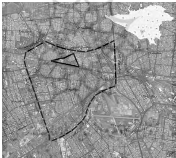
شکل ۱ موقعیت محله امامزاده حسن در منطقه هفده شهر تهران

محله امامزاده حسن در منطقه هفده شهر تهران واقع شده است. نزدیکی این منطقه به مرکز شهر، مجاورت آن به مراکز کار و اشتغال مستقر در غرب تهران، وجود چهار محور اصلی ارتباطی در پیرامون آن و استقرار سه بازار فرامنطقه‌ای مبل یافت‌آباد، کیف و کفش امین‌الملک و صنایع آلومینیوم قلعه‌مرغی از ویژگی‌های برجسته آن است. این منطقه شامل ۳ ناحیه و ۲۱ محله است که محله امامزاده حسن، محله ۳ از ناحیه ۱ در محدوده شمالی آن است (شکل ۱).