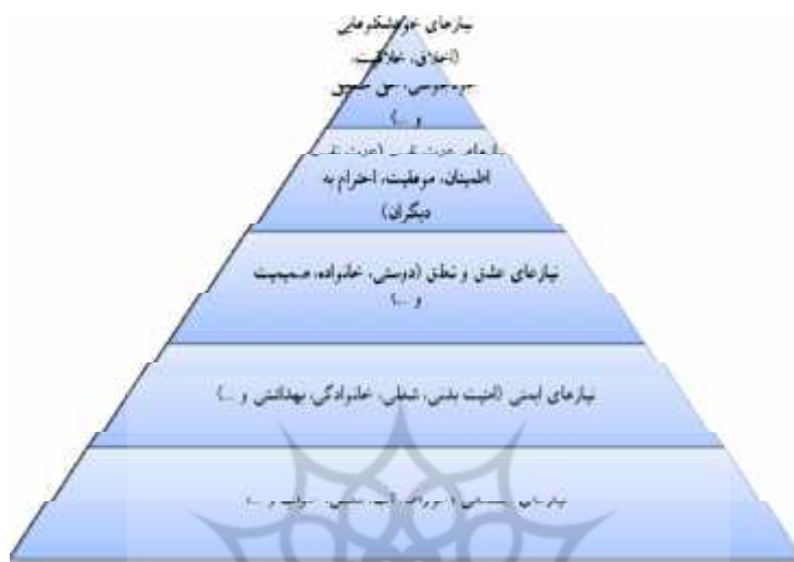
شکل ۱. سلسله‌مراتب نیازها از نظر مازلو

سلسله‌مراتبی است که عبارت‌اند از: نیازهای جسمانی، نیازهای ایمنی، نیازهای تعلق و عشق، نیازهای عزت نفس و نیازهای خودشکوفایی (مازلو، ۱۳۷۲: ۷۱).