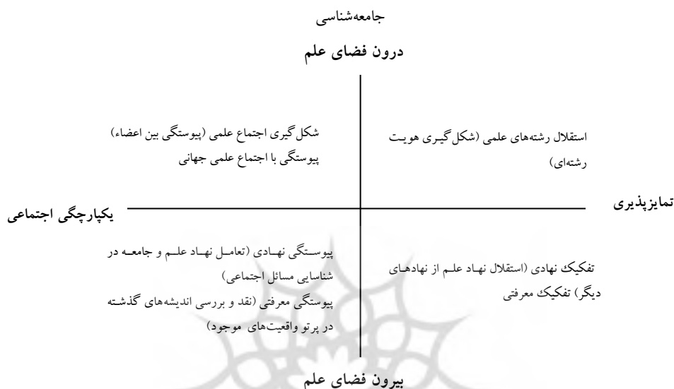
شکل ۱. ترکیب دو ویژگی ساختاری و معرفتی تمایزپذیری و یکپارچگی در درون و فضای بیرون

است. اما برای دستیابی به مدل پیشنهادی مقاله نمی‌توان تنها به این نظریات استناد کرد، زیرا ممکن است شرایط جامعه ایران یا جامعه‌شناسی در ایران با جوامع دیگر یا علوم دیگر متفاوت باشد. بر این اساس برای تبدیل مفروضات به شاخص، در ادامه اسناد حاصل از مصاحبه با صاحب‌نظران جامعه‌شناسی مورد تحلیل قرار می‌گیرد تا مدل پیشنهادی مورد نظر از اتقان بیشتری برخوردار شود.