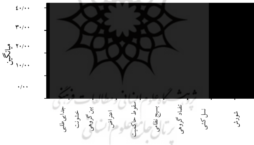
نمودار ۱. ترتیب میانگین متغیرهای تضاد در کشورهای جهان