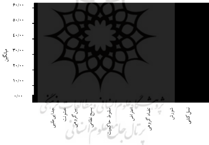
نمودار ۲. ترتیب میانگین متغیرهای تضاد در منطقه خاورمیانه