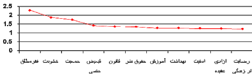
جدول ۲. جمع بندی دور پنجم