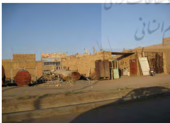
شکل ۱- ریختن زباله‌ها و نخاله‌های ساختمانی در حاشیه

ریختن نخاله‌های ساختمانی در معابر و اراضی بایر محصور و غیر محصور درون محله: براساس مشاهدات و برداشتهای میدانی این گونه بی‌نظمی و قانون‌گریزی بصورت یک فرهنگ بر محله حاکمیت دارد (شکل ۱)