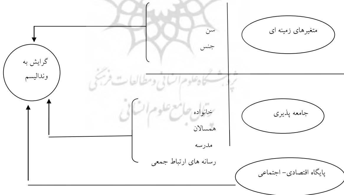
شکل ۱- مدل نظری استخراج شده از فرضیات مورد بررسی

در نهایت، آر کلارک مدل جامعه‌تری را از متغیرهای مستقل مؤثر بر وندالیسم ارائه داد. او هشت گروه از این متغیرها را مشخص نمود که عبارتند از: تجارب نخستین دوران کودکی، توارث، شکل‌گیری شخصیت بزهکار، عوامل شخصیتی، اجتماعی و اقتصادی، شرایط و وضعیت فعلی زندگی فرد، بحران‌ها و وقایع، شرایط خاص موجود و در نهایت، جریان‌های شخصی و انگیزشی فرد. در واقع این مدل، خود به تنهایی می‌تواند اکثر فرضیه‌های این پژوهش را تبیین کند. از جمله رابطه متغیرهای سن و جنس با رفتارهای خرابکارانه توسط مدل کلارک قابل تبیین هستند. در این بررسی، ترکیبی از نظریات ارائه شده، برای تبیین فرضیه‌های موجود استفاده شده که در قالب مدل نظری زیر ارائه شده است: