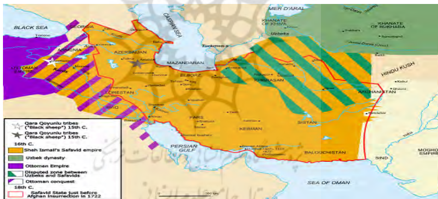
نقشه شماره (۱): سرحدات امپراتوری‌های ایران و عثمانی

اختلافات مذهبی میان ایران و عثمانی، مشکلات ایلات و عشایر مرزی و تابعیت آنها، وجود قومیت‌های گوناگون مرزنشین و از میان آنها آرامنه و مسأله سکونت شیعیان و تمرکز فرهنگی - مذهبی آنها در عتبات عالیات و مهاجرت‌ها و زیارت‌ها و سفر ساکنان پاره‌ای از مناطق ایران برای انجام مراسم حج از طریق سرزمین‌های عثمانی و همچنین، اوضاع اقتصادی و سیاسی و جز اینها، همواره ناامنی و اغتشاش‌هایی را در مناطق مرزی، به ویژه بخش‌های کردنشین و عرب‌نشین پدید می‌آورد. جنگ‌های ایران و عثمانی و به تحقیق نبردهای تاریخی ایرانیان و رومیان در گذشته‌های تاریخی در همین شرایط شکل گرفته است و به همین سبب، مرزهای ایران با کشورهای غربی خود، همواره نامشخص و در حال تغییر و دگرگونی بوده است (تکمیل همایون، ۱۳۸۰: ۶۳).