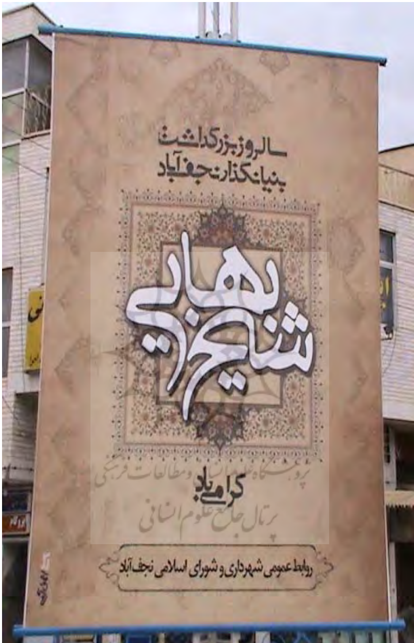
شکل ۱: انتساب شهر نجف آباد به شیخ بهایی. (میدان شهرداری نجف آباد، ۳ اردیبهشت ۱۳۸۸).