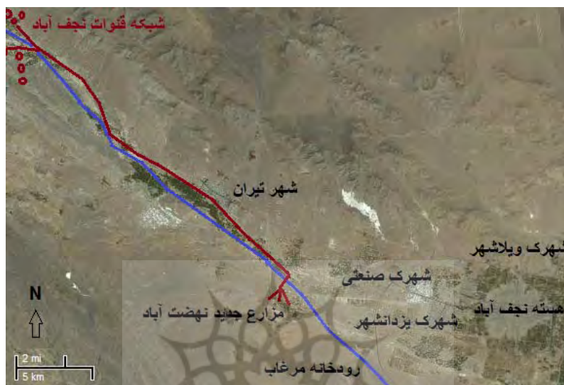
شکل ۸: انحراف قنوات نجف آباد و اجرای طرح جدید کشاورزی (ترسیم بر اساس تلفیق مطالعات کتابخانه‌ای و میدانی).

نیز از بین بروند بخشی از آب قنوات ۴۰۰ ساله در این شهر جاری گردد. وجود آب و درخت در فضای شهر باعث شادابی و سرزندگی مردم خواهد شد.