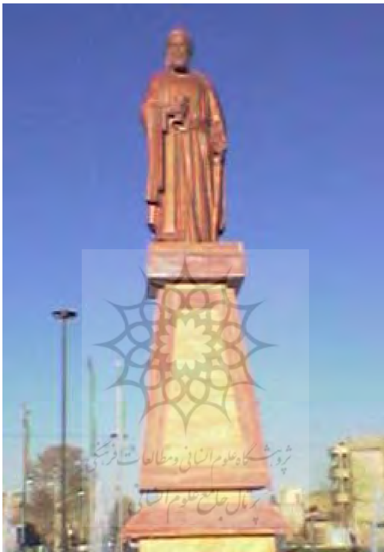
شکل ۲: مجسمه شیخ بهایی در ورودی شهر ( میدان آزادگان).

طراحی شهر نجف آباد، جلوه‌ای از حاکمیت تفکر برنامه ریزی ناحیه‌ای در عصر صفوی / ۵