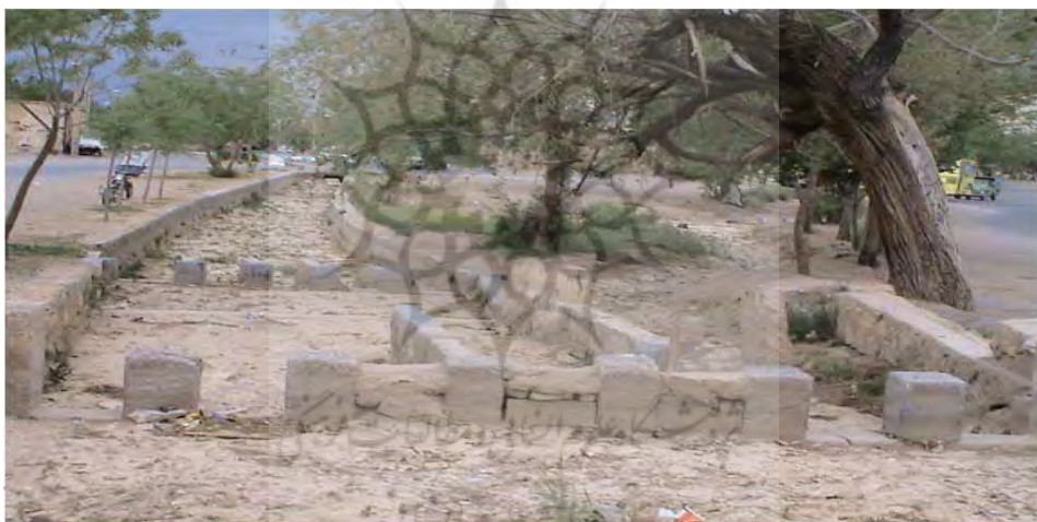
شکل ۵: محل تقسیم آب قنوات نجف آباد معروف به هفت لتی (مجاور مرکز تربیت معلم دکتر آیت).

(۲). در حدود ۶ کیلومتری غرب نجف آباد و قبل از آنکه آب قنوات به شهر برسد، سیل بندها و استخرهایی تعبیه شده بود. آب قنوات در قسمتی از فصول پاییز و زمستان که کشاورزان نیازی به آب نداشتند، به این مکان هدایت می شد و از هدر رفتن آب به داخل شهر و باغات و احیانا "تخریب ساختمان‌ها و باغات جلوگیری می شد. همچنین، با نفوذ این آب‌ها در زمین، سفره‌های آب زیر زمینی منطقه تقویت شده و قنات‌های روستاهای پایین دست پر آب تر می شدند (غیور، ۱۲۵، ۱۳۷۰). هنگامی که آب قنوات به غرب نجف آباد و محلی به نام فعلی امیر آباد می رسید (شکل ۵)، طی چند مرحله به ۱۷ سهم تقسیم می گردید (۳) و هر سهم در جوی جداگانه‌ای جاری می گشت.