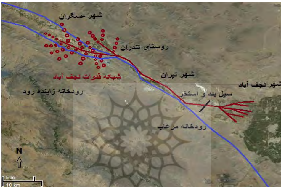
شکل ۴: شبکه تامین و توزیع آب قنوات شهر نجف آباد (ترسیم بر اساس تلفیق تصاویر ماهواره ای و اسناد مالکیت قنوات).

تشکیل می دهند. در ادامه، این جوی مسیری طولانی ۳۵ کیلومتری را بصورت روباز و از میان ۷ روستا تا نجف آباد طی می کند (دفتر قنوات نجف آباد، ۱۳۴۶، ۲۰-۲) (شکل ۴). دبی این جوی به طور متوسط در حدود ۷۰۰ لیتر در ثانیه است.