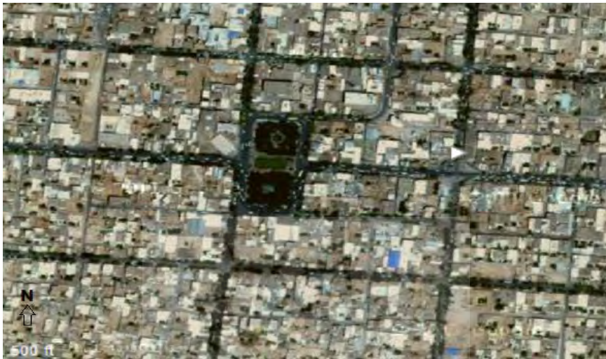
شکل ۷: تصویر مرکز شهر نجف آباد در وضعیت فعلی (گوگل ارث، ۱۳۹۱).

فرسوده بودن ساختمان‌های احداث شده در آن، در طرح بازسازی شهر این گردشگاه احیا شده و کاربری گذشته خود را باز یابد (تصاویر ۶ و ۷ مقایسه شود).