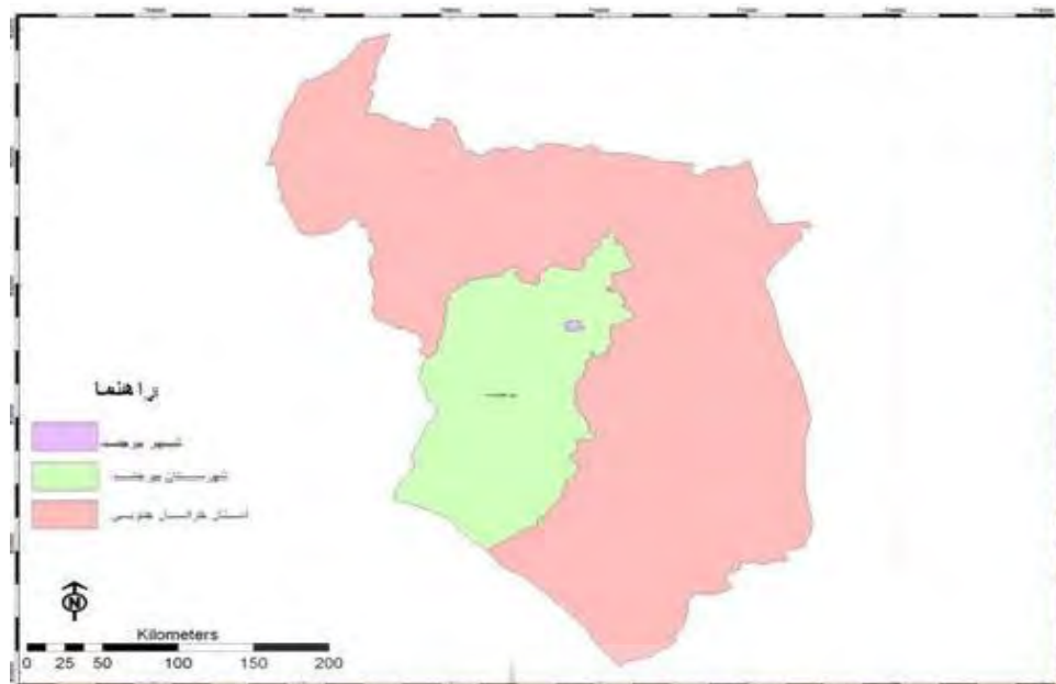
نقشه ۱- موقعیت جغرافیایی شهر بیرجند