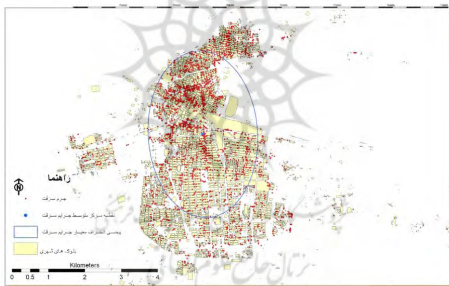
نقشه ۳- نقطه مرکز متوسط و بیضی انحراف معیار جرایم سرقت شهر بیرجند در دوره ۱۸ ماهه

-الگوی فضایی توزیع جرایم سرقت در شهر بیرجند در راستای تعیین الگوی توزیع فضایی جرایم،