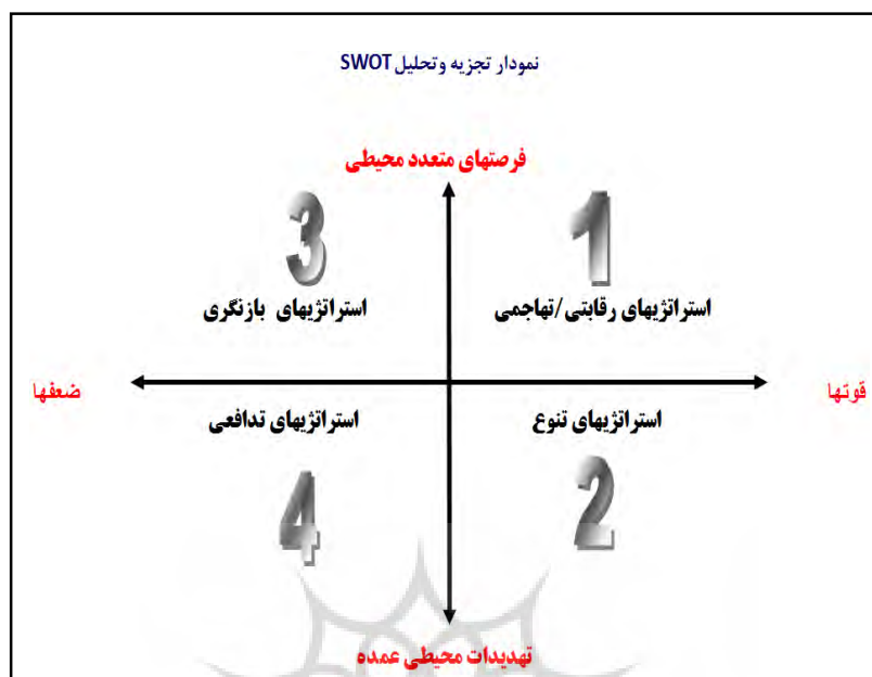
شکل ۳: نمودار تجزیه و تحلیل SWOT و انواع استراتژی‌ها