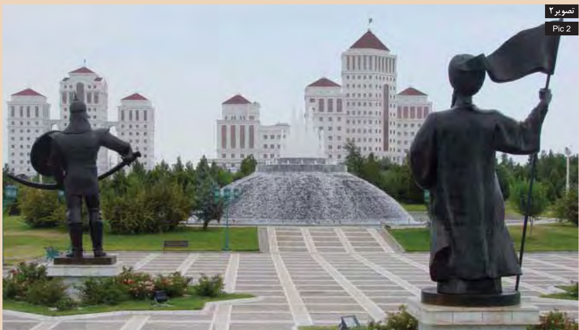
تصویر ۲ Pic 2

Pic1: The contradiction between the new and old images of the White City of Ashkhabad, Turkmenistan.