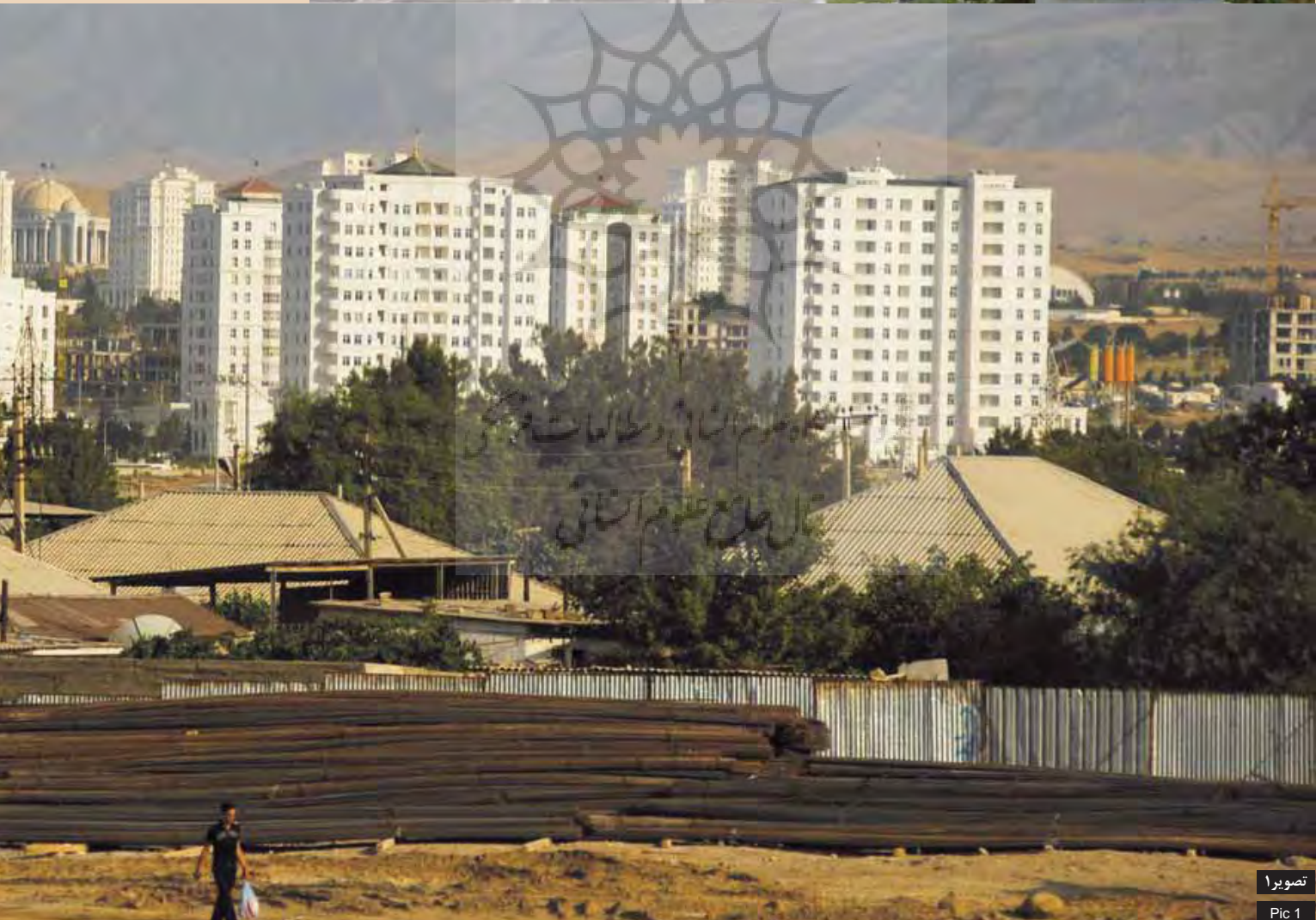
تصویر ۱ Pic 1