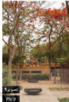
تصویر ۹ Pic 9