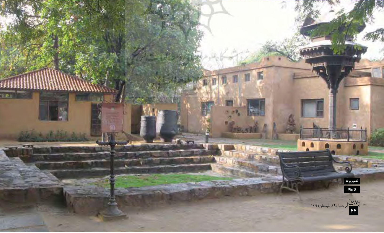
تصویر ۸ Pic 8