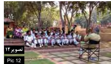
تصویر ۱۲ Pic 12