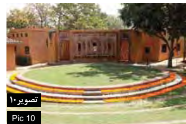
تصویر ۱۰ Pic 10