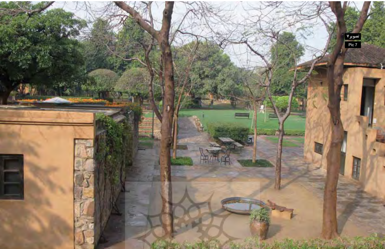
تصویر ۷ Pic 7