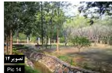
تصویر ۱۴ Pic 14