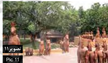
تصویر ۱۱ Pic 11