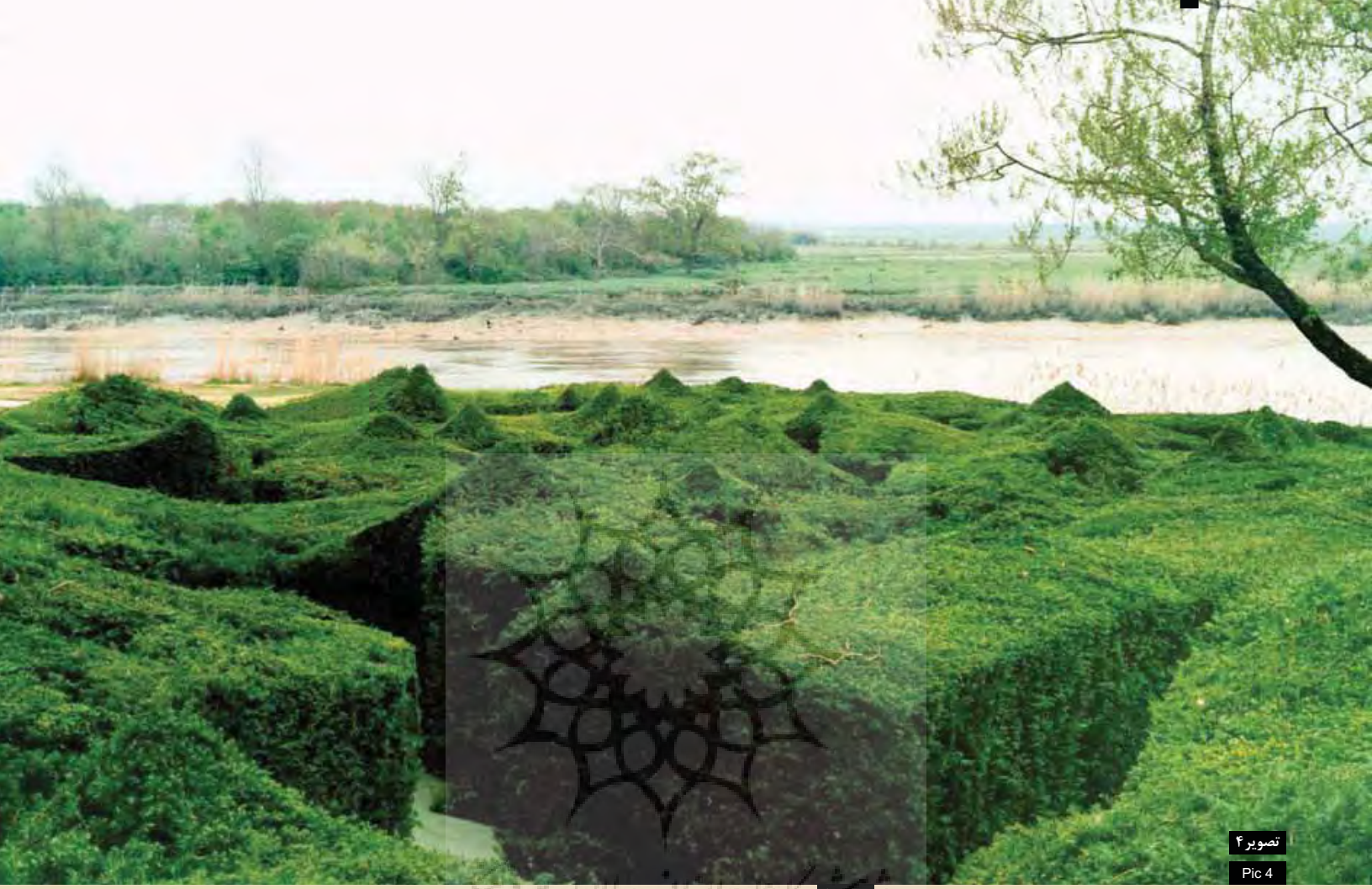
تصویر ۴ Pic 4

تصویر ۵ کتابخانه علوم انسانی و مطالعات عربی پرتال جامع علوم انسانی