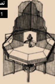
تصویر ۱ Pic 1

Pic1: View point nearby Nimes-Caissargues highway projects in the boundary between object and landscape, is part of a whole perspective.