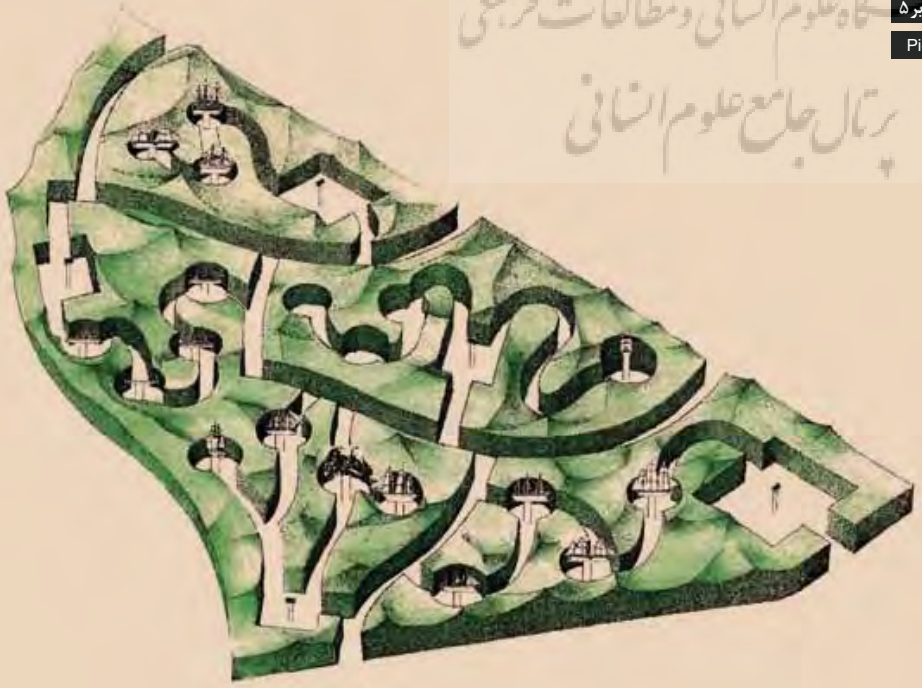
la logistique de l'édifice complexe

تصویر ۵ کتابخانه علوم انسانی و مطالعات عربی پرتال جامع علوم انسانی