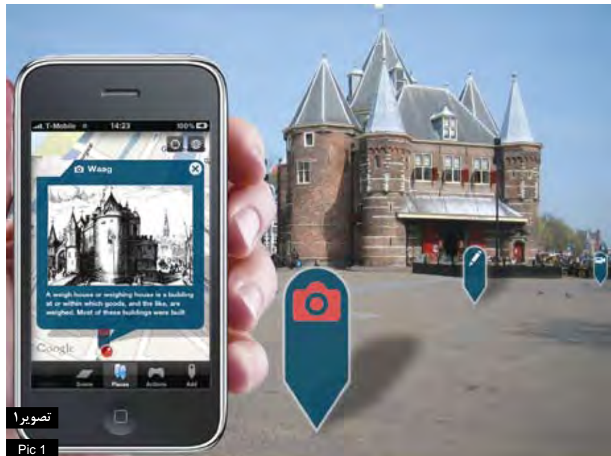
تصویر ۱ Pic 1

اهمیت و لزوم استفاده از ICT در صنعت گردشگری نسبتاً موضوع جدیدی است. با دنبال کردن سیر نفوذ ICT در محیط کسب‌وکار، نویسندگان بسیاری به توصیف منافع ICT در گردشگری پرداخته‌اند که بررسی آن در این مجال نمی‌گنجد. اما مدل ارایه شده توسط «بوهالیس» در ذیل به خوبی نمایانگر تپانبات اجزای برشمرده شده در بالا است.