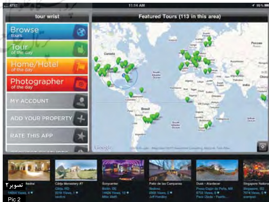
تصویر ۲ Pic 2

تصویر ۲: امروزه از طریق اینترنت و رایانه امکان برنامه‌ریزی کامل سفر از جمله تعیین مسیر، تهیه بلیط و رزرو هتل برای کاربران فراهم شده است.