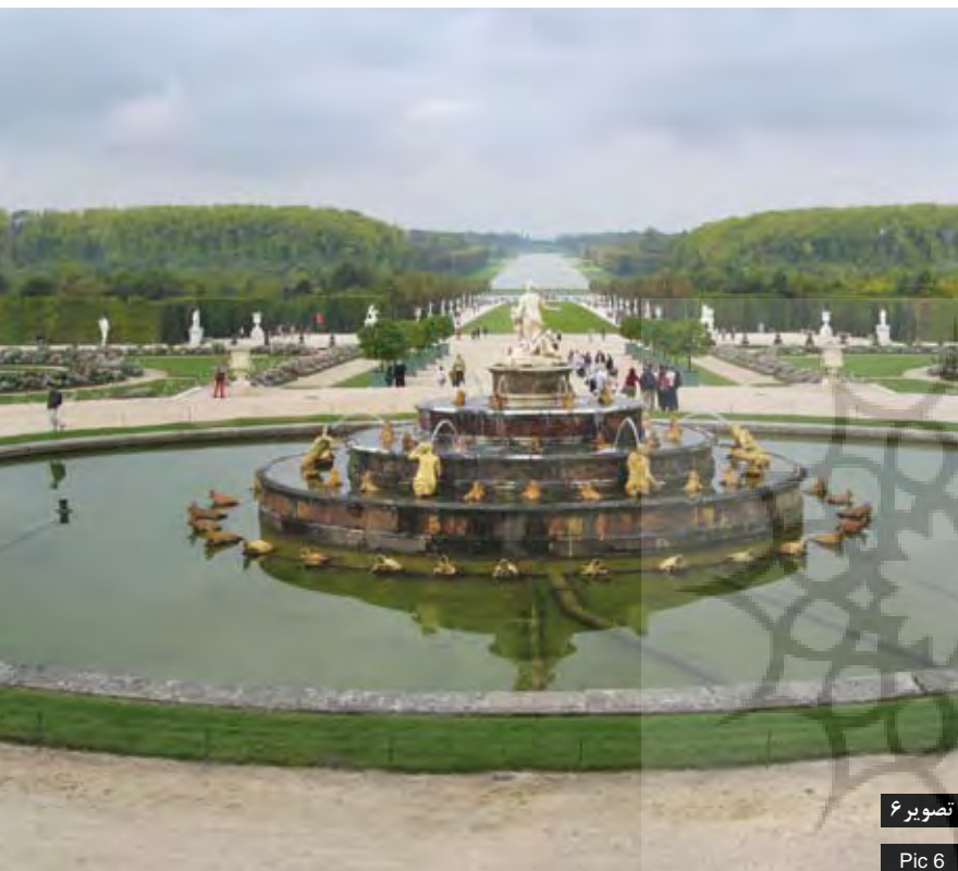
تصویر ۶ Pic 6

تصویر ۵: پارک دیده‌روت. تخته‌سنگ‌های موجود در آبشار یادآور سنگ‌های باغ ذن ژاپنی است. عکس: سید محمد باقر منصور، ۱۳۹۰. Pic5: Parc Diderot. The rocks in cascade remind Japanese Zen rock gardens. Photo by: Seyed Mohammad Bagher Mansouri, 2012.