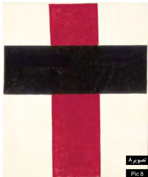
تصویر ۸ Pic 8

تصویر ۸ : تقاطع. اثر کازیمیر مالوویچ. حذف همه چیز در آثار مینیمالیست‌های مدرن برای رسیدن به فرم خالص. Pic8: "The Cross". By Kazimir Malevich. Modernist minimalists illuminate everything to reach to the pure form.