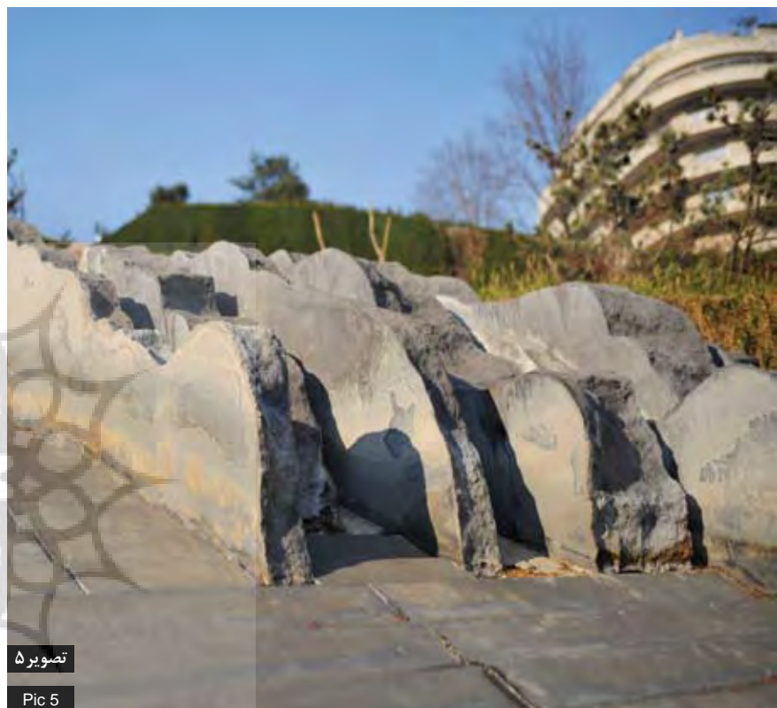
تصویر ۵ Pic 5