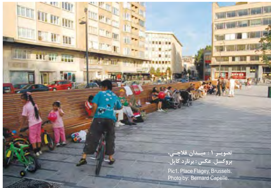
تصویر ۱: میدان فلاچی، بروکسل. Pic1. Place Flagey, Brussels.