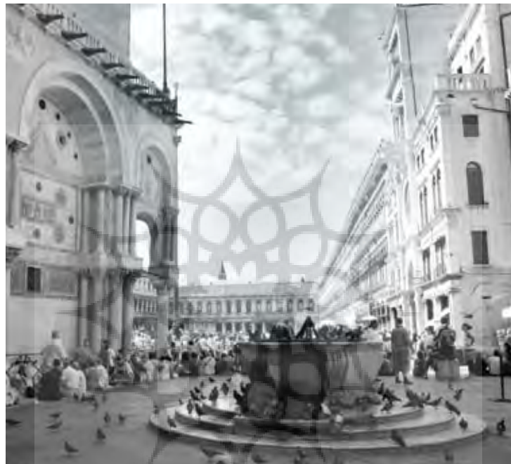
تصویر ۳: پیچیدگی درکی که ساکنین، در فرهنگ‌ها و دوره‌های زمانی مختلف، از محیط‌شان دارند. به یک عنصر کلیدی در تفکرات معاصر تبدیل شده است. میدان سن مارکو، ونیز، ایتالیا. عکس: فروش پورصفوی، ۱۳۸۶.

او همایش «چشم‌انداز منظر مدرن» را در ۱۹۹۰ برگزار می‌کند ۳۲ . پژوهش‌ها و همایش‌هایی که پیشتر توسط او و گروه همکارانش هدایت شده‌اند، به خوبی نشان داده که تأثیر فرهنگ‌ها و جغرافیاهای مختلف بر مفهوم منظر، اساسی است. متناسب با زمان، شکل‌گیری نگرانی‌ها و بالارفتن شناخت و آگاهی مردم نسبت به منظر، باعث می‌شود که در ۱۹۹۳، قانون منظر ۳۳ ، در جهت محافظت و همچنین برای ایجاد تغییرات ضروری در منظر، در فرانسه تصویب شود. همانطور که اگوستن برک در "مدیانس: مکان‌های منطری" تأکید می‌کند: "در مورد مکان، همه چیز به روابط، مقیاس و اندازه مربوط می‌شود؛ در مکان هیچ چیز ذاتی، مطلق، یا جهانی وجود ندارد." (Berque, 1990: 38) انتشار اکومن