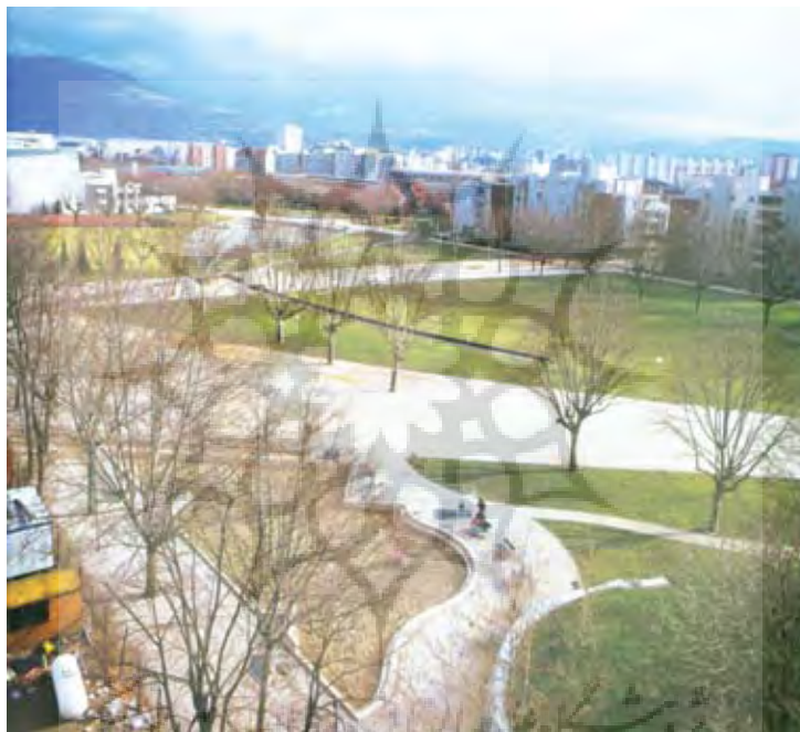
تصویر ۲: با ظهور شهرسازی مدرن و تأکید بر برنامه‌ریزی‌های شهری، طراحی فضاهای باز بین ساختمان‌ها و فضاهای سبز شهری دغدغهٔ اصلی منظر شهری شد. گرونوبل، فرانسه.

این دعوتی است برای تغییر در بینش فرهنگی ما که شهر و طبیعت را در مقابل هم قرار می‌دهد. همچنان که در مورد تاریخ منظر شهر پاریس می‌بینیم، این تغییر تنها به نوشته‌ها وابسته نیست و در دیگر رسانه‌ها هم به آن پرداخته می‌شود. مثلاً در سال ۲۰۰۲، یک لوح فشرده با اسم تجاری «شهرهای اسرارآمیز آسیا»، تهیه شده توسط کارگردان‌های خارجی، نگاهی پژوهشگر و مفسرانه به شهرهای پکن، بنارس، جاکارتا، کاتماندو، اصفهان و کیوتو، می‌اندازد. به دور از یک خوانش کلیشه‌ای، این اثر، عناصر دارای معنا برای ساکنان این شهرها را شناسایی می‌کند. کشف کیوتو به‌واسطهٔ جریان آبی که از آسفالت بیرون می‌زند، ممکن می‌شود و شناخت بنارس، از طریق سیر در لایه‌های ماوراءطبیعی زندگی، مرگ و تولد دوباره. به این ترتیب، اگر از مفهوم سادهٔ زیباشناختی آن بگذریم، به نظر می‌رسد که اصطلاح «منظر شهری» در آثار، بیشتر بازتاب ایدهٔ «طبیعت شهری» است (جوهر طبیعت درونی شهر)، همانند اصطلاح «چشم‌انداز (منظر) اقتصادی» که برای پرسش از ویژگی‌ها، معنا و بسط اقتصاد به کار می‌رود. در اینجا، مسئله، درک شهر به عنوان یک «موجود زنده»