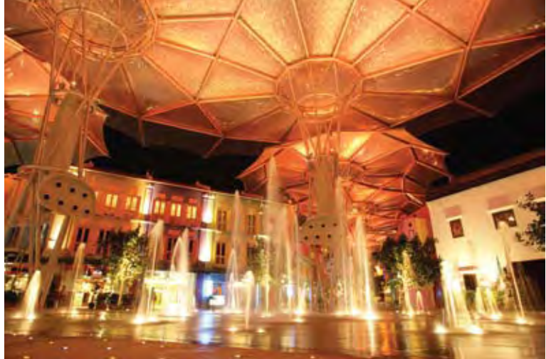
تصویر ۳: آب‌نماها و فواره‌ها به این منطقه شادابی و سرزندگی خاصی بخشیده است. اسکله کلارک، مأخذ: www.clarkequay.com

مقصودی، ۱۳۸۴؛ حبیبی و پوراحمد و مشکینی، ۱۳۸۶؛ برک پور، ۱۳۷۸؛ خانی، ۱۳۸۳؛ فلامکی، ۱۳۷۹؛ عندلیب، ۱۳۸۵؛ (Scott, 2006 Florida, 1996).