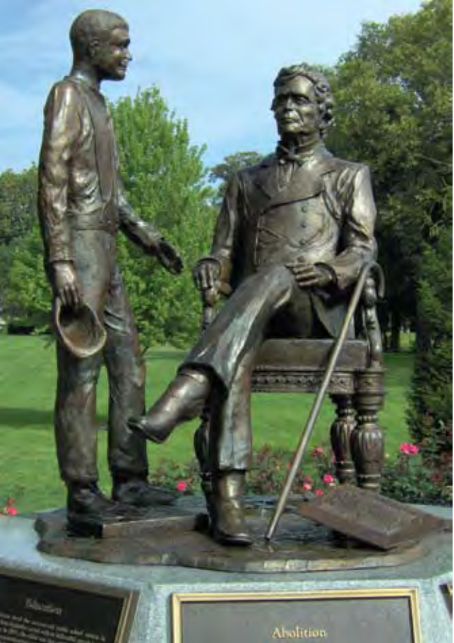
تصویر ۲: استفاده از مجسمه «استیونز»، شخصیت سیاسی مشهوری که محدوده نیز به نام وی است، مأخذ: www.picasaweb.google.com