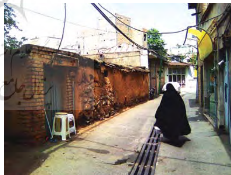
تصویر ۵: یکی از بناهای قدیمی شاخص محله با مصالح بومی.