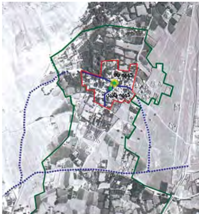
سازمان فضایی ده جماران ماهیت کلی روستای کوهستانی در شهرستان قلمرو و محدوده دره یک قلمرو و محدوده دره دو استخوانبندی و ساختار کل های کوهستان و محلات ده شامل کوه بالا، کوه پایین، جوارستان، سر فرستان، باغات و زمین های کشاورزی هسته و مرکزیت درختان کهنسال

دید و مناظر گم شده‌ای است که به ناگاه و در پی پیچش ناگهانی معبر ایجاد می‌شود. حفظ این توالی‌ها به عنوان یکی از شاخصه‌های بافت در طراحی باید مورد توجه قرار گیرد که نکته مهم، توجه به طراحی نقاط عطف بصری در آنهاست. در نمونه‌های بسیاری، انتهای دید با سردر زیبا و یا نمایی با پنجره‌های کشیده و بلند به سمت معبر تعریف شده است (تصویر ۷).