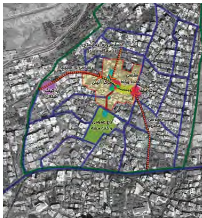
سازمان فضایی پیشنهادی محله جماران - ماهیت کلیه محله ای با ساختار روستایی و تاریخی در تهران

همچنین از نکات منحصر به فرد این منطقه، بیت امام خمینی (ره) در آن بوده است که موجب تبدیل جماران به کانون تصمیم‌گیری و هدایت ایران و برخورداری از شهرتی جهانی شده است. همچنین بین سال‌های ۵۹ تا ۶۸ کانون سیاسی ایران بوده است که خود بر اهمیت تصمیم‌گیری در بافت می‌افزاید. در برنامه‌ریزی سعی بر آن بوده است، ساختاری زنده و منسجم برای بافت موجود تعریف شود و با تفکیک لایه‌های عملکردی در دو مقیاس "ملی" (بازدیدکنندگان حسینی و بیت امام) و "محلی" (ساکنین) آرامش محله حفظ و نیازهای بازدیدکنندگان نیز برآورده شود تا با اتصال درست بافت ارگانیک با بافت نوساز، بستری مناسب برای فعالیت‌های روزانه و ویژه در این منطقه فراهم شود ■