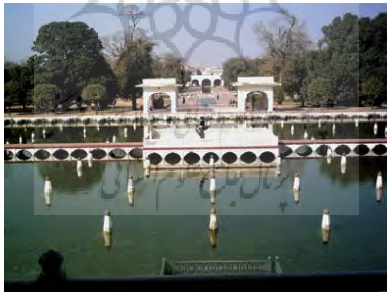
تصویر ۶: صفت‌های کنار استخر (باغ آب) ساخته شده به دستور شاه جهان، باغ شالیمار، ۴۲-۱۶۲۳م.