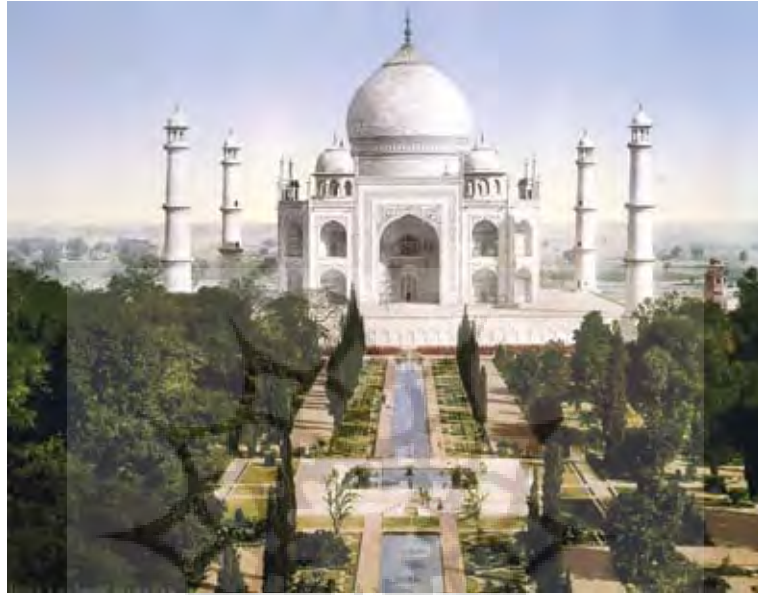
تصویر ۲: باغ آب با دید وسیع، حداقل درختان با کوشک عظیم، تاج محل.