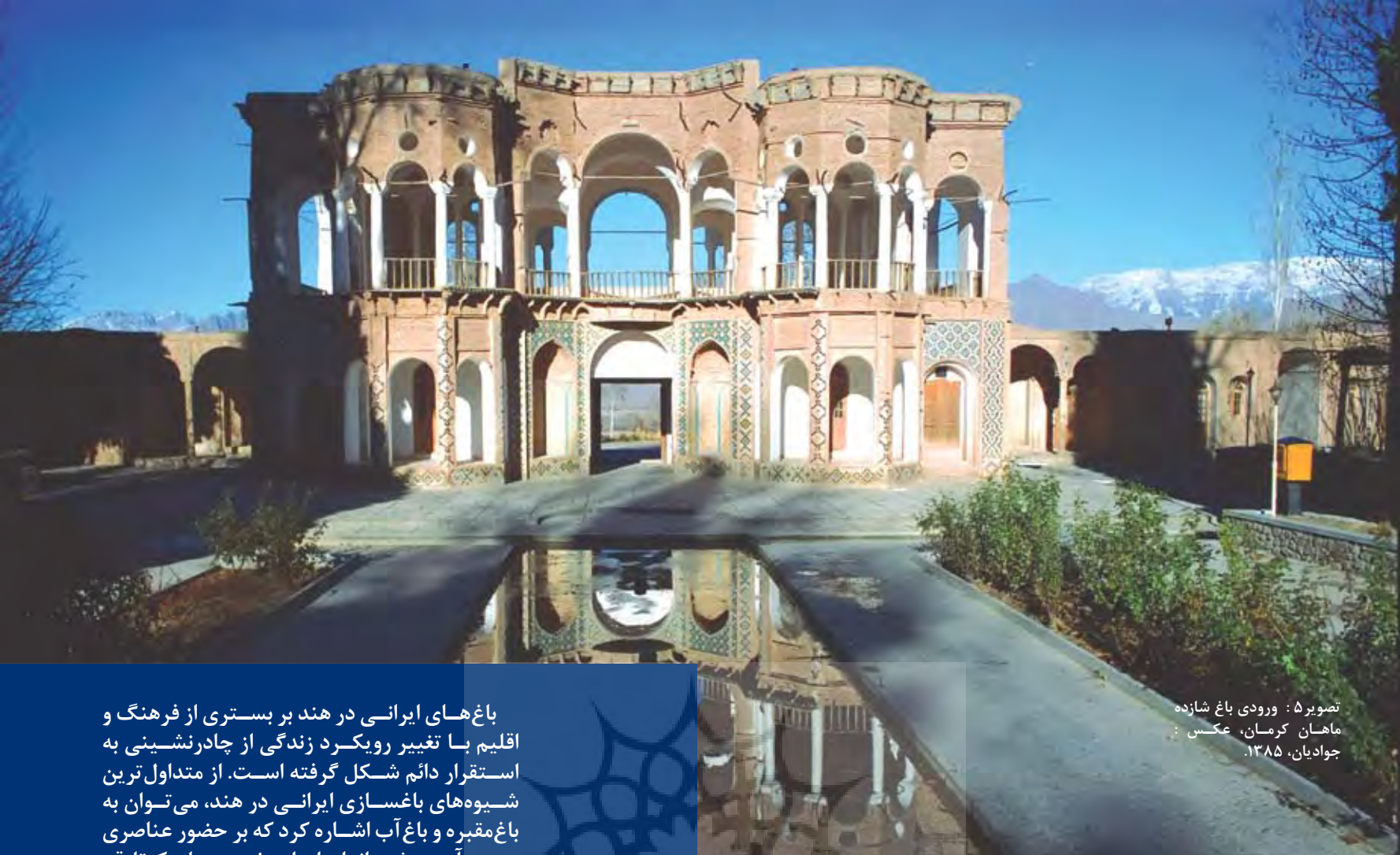
تصویر ۵: ورودی باغ شازده ماهان کرمان، عکس : جوادیان، ۱۳۸۵.

باغ‌های ایرانی در هند بر بستری از فرهنگ و اقلیم با تغییر رویکرد زندگی از چادرنشینی به استقرار دائم شکل گرفته است. از متداول‌ترین شیوه‌های باغسازی ایرانی در هند، می‌توان به باغ‌مقبره و باغ آب اشاره کرد که بر حضور عناصری چون آب، چشم‌انداز باز با درختچه‌های کوتاه قد تأکید می‌ورزد.