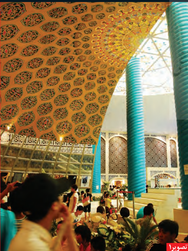
تصویر ۱: غرفه ایران، اکسیو ۲۰۱۰ شانگهای چین، عکس: سیدمحمدباقر منصور، ۱۳۸۹.

◀ علت پیدایش و برگزاری نمایشگاه‌های جهانی اکسیو را باید در دوران اوج انقلاب صنعتی در غرب و تحولات مرتبط با آن جست. از آن روزگار تا چند دهه پیش، کشورها و دولت‌ها اصلی‌ترین متولی توسعه علم و صنعت به‌شمار می‌رفتند. لذا پیشرفت روزافزون شاخه‌های مختلف تکنولوژی، می‌طلبید تا آخرین دستاوردهای صنعتی کشورها در نمایشگاهی ارائه و از این رهگذر، پیشرفت‌های صنعتی برای متحیرساختن رقبا جهانی و به‌رخ‌کشیدن توان کشورهای شرکت‌کننده به نمایش گذاشته شود. اما به نظر می‌رسد امروزه چنین رقابتی از دست دولت‌ها خارج شده و در میان شرکت‌های بزرگ چندملیتی در جریان است. از سوی دیگر باید توجه داشت که رقابت در حوزه معماری و صنعت ساختمان نیز همواره به‌عنوان بخش جذابی از هم‌اورد اکسیو، مورد توجه صاحب‌نظران و بازدیدکنندگان بوده است.