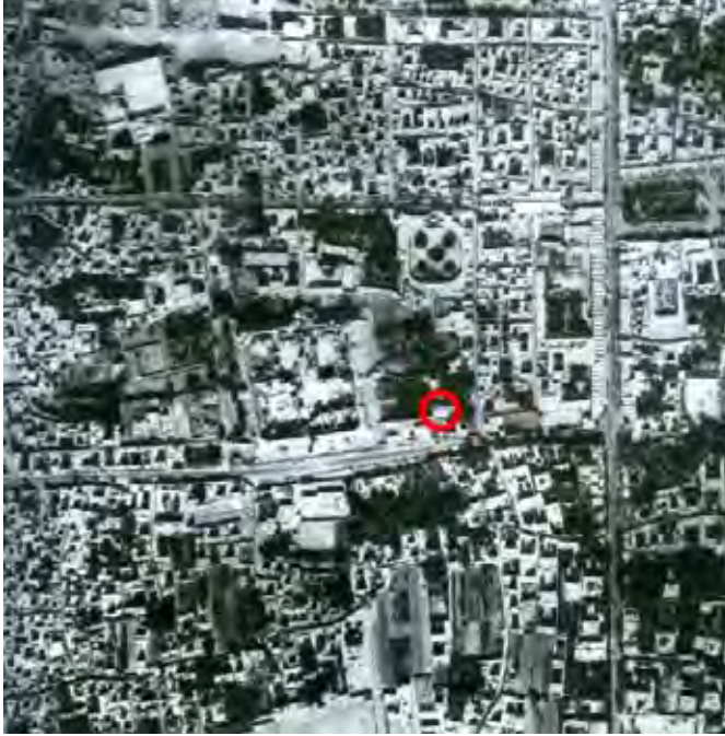
۱: عکس هوایی از بافت تاریخی طبس، قبل از زلزله ۱۳۵۷، مأخذ: سازمان نقشه برداری.

به نظر می رسد تأمل در این عکس ها، حداقل برای دو گروه، فرصت ها و زمینه های پژوهش را معرفی کند: معمارانی که به مهندسی بنا توجه خاص دارند و متخصصان شهری که به سامان دادن بافت های شهر، اهتمام می ورزند.