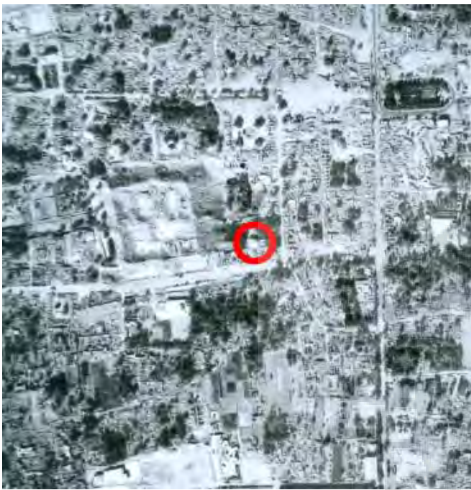
۲: چند روز پس از زلزله ۱۳۵۷، آبنبار های سالم در میان ویرانه های شهر، سایه چندین گنبد پابرجا پس از زلزله بر زمین مشهود است.