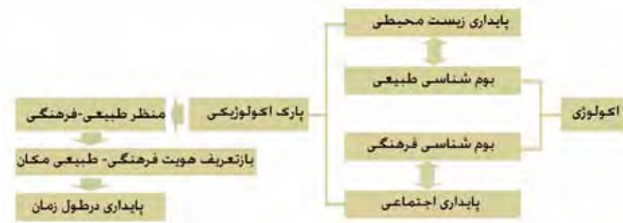
۳: اکولوژی طبیعی- فرهنگی در پارک اکولوژیک، مأخذ: نگارنده.

● تکنولوژی: بناها و ساختمان‌ها در اکوپارک به نحوی طراحی می‌شود