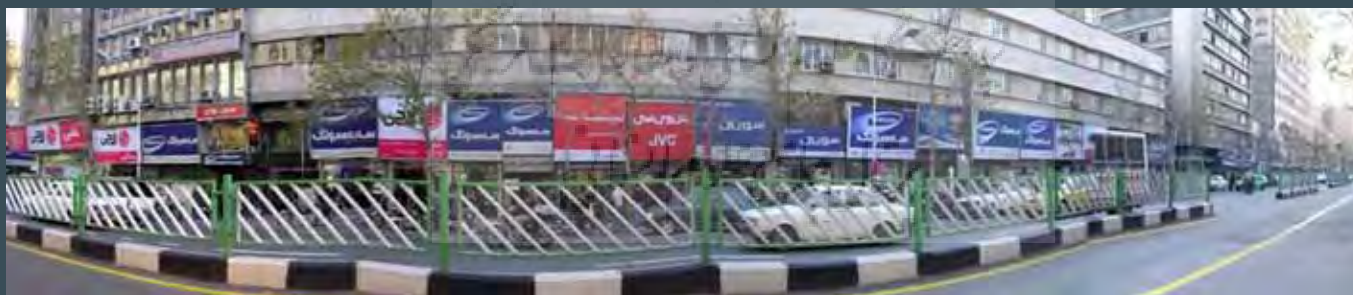
۵: انبوه‌سازی‌هایی با بدنه یکدست، محصول تفکر استفاده حداکثری از فضای قابل بهره‌برداری، عکس: نگارندگان.