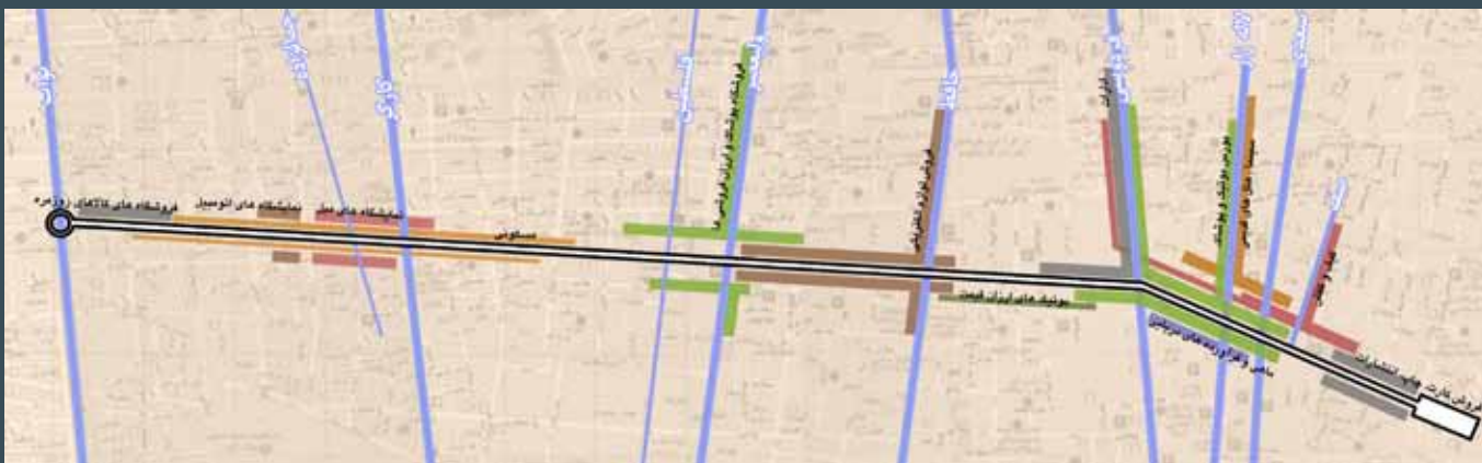
۶: حوزه‌بندی خیابان جمهوری بر اساس کاربری‌ها و بورس‌های فعال آن، مأخذ: نگارندگان.