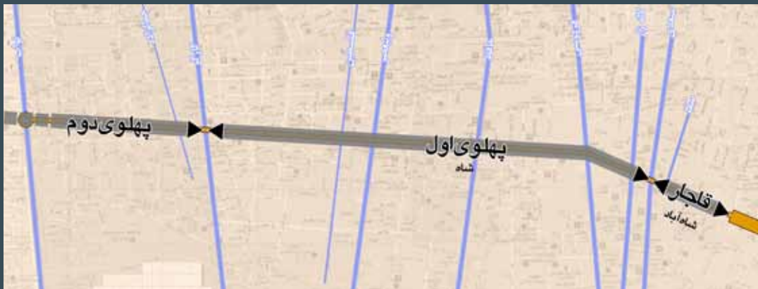
۳: تعیین محدوده‌های زمانی شکل‌گیری خیابان جمهوری، مأخذ: نگارندگان.