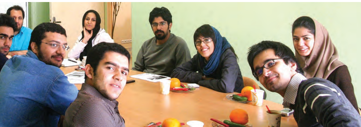
میز گرد انجمن معمار ۲۴ - پژوهشکده نظر