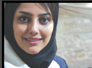
شاکویی / دانشگاه آزاد اسلامی، تهران جنوب

اصلاً مفهوم خلاقیت برای ما وجود نداره! ما همون فرم‌هایی که دیدیم را چپ و راستش می‌کنیم و می‌شه یه فرم جدید! منظور از خلاقیت کشف عرصه‌های جدیدتره. چون مادر شرایط ایده‌آل زندگی نمی‌کنیم،