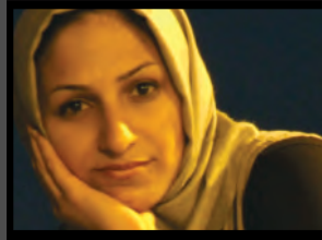
یم منصوری / دانشگاه آزاد اسلامی، تهران مرکز