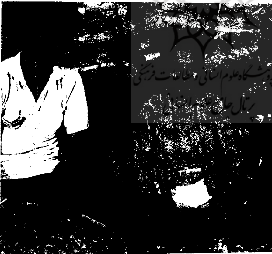
برخی از تعاونیهای کسبه محصولات کشاورزی و عمدتاً پیاز و سیر می‌فروشند.

دبیرستانهای اقتصاد تعاونی و آکادمیهای تعاونی ملاحظه کرد: هزینه همه اینها را نهضت تعاون تأمین می‌کند. به همین ترتیب، مؤسسه مدیریت تعاونیهای اندونزی ۸ توسط وزارت تعاون مورد حمایت خاص قرار گرفته و در نتیجه از توسعه قابل ملاحظه‌ای برخوردار شده است.