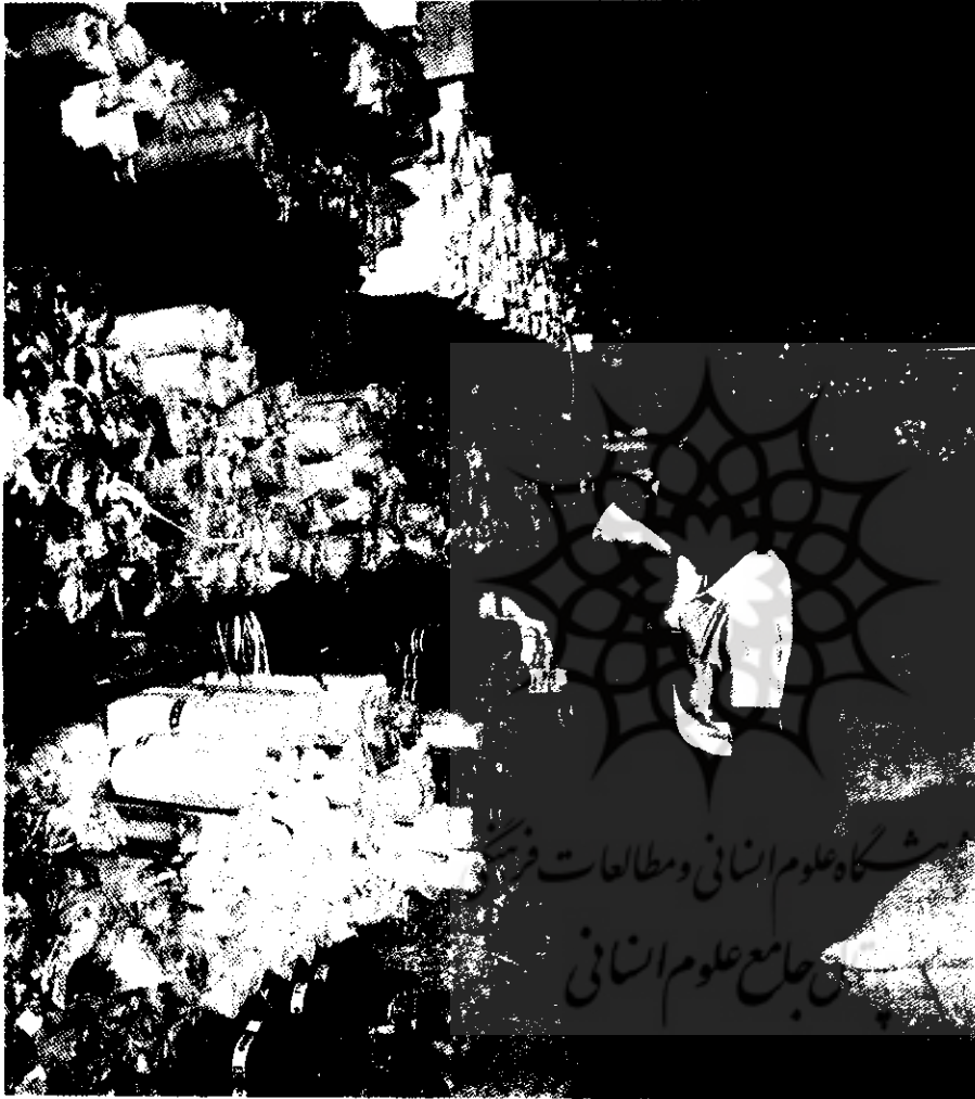
جدول شماره ۸: تعداد افراد شرکت‌کننده در برنامه‌های آموزشی و آموزش ضمن خدمت تعاونیها

برای اطمینان از اینکه تعاونیها در همه جا یکسان اداره می‌شود لازم است سرپرستی تعاونیها سریع و دقیق باشد. به منظور تقویت سرپرستی تعاونیهای خدمات بر حسابرسی تأسیس شده و توسعه یافته است. دلیل ایجاد و گسترش این تعاونیها، آن است که اداره حسابرسی نمی‌توانست چنین وظیفه‌ای را انجام دهد. در اغلب مواقع عملکرد نامطلوب، معلول فقدان دانش و تجربه است. هدف این