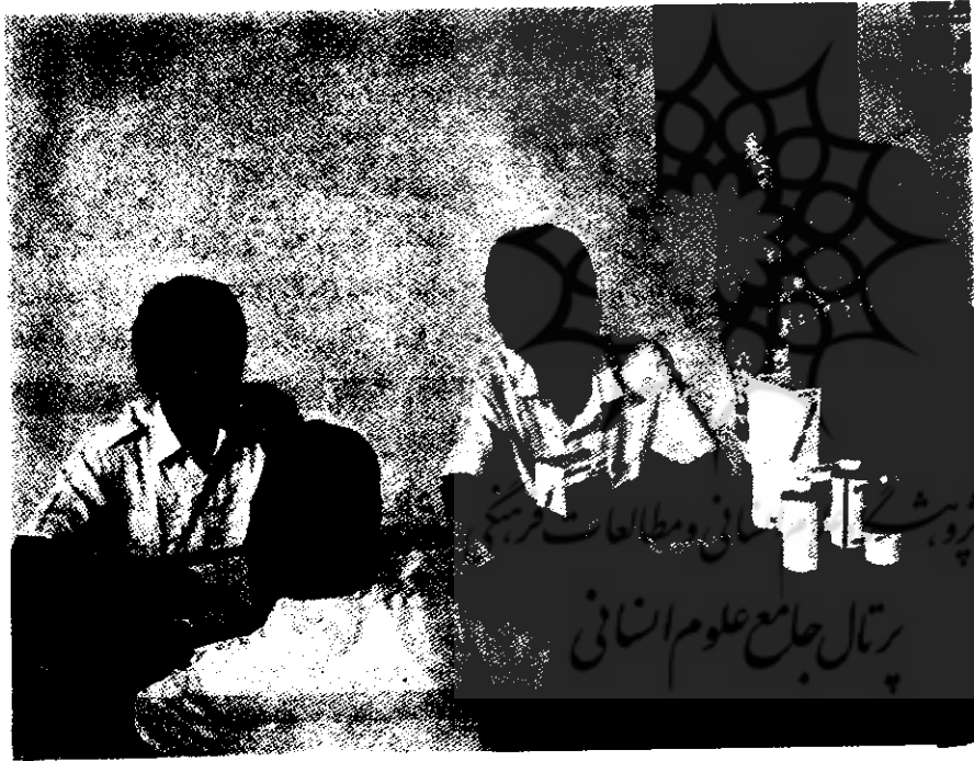
هماهنگی فعالیتهای عادی و فوق برنامه جوانان با نتایج عظیم.

اندوخته‌های تعاونیها نیز در همان مدت از ۲۳۵۱۹ به ۷۲۱۴۸ میلیون روپیه رسید. کل سرمایه در سال ۱۹۸۳، ۵۳۷۶ میلیارد روپیه بود که در سپتامبر ۱۹۸۷ به ۱۱۸ ۳۸۱