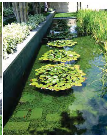
گلپهای نیلوفر آبی در استخر آب