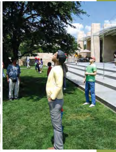
مجسمه های قابل دسترس توسط بازدیدکنندگان

الموس بودن مجسمه‌ها و دیدن آنها در فضای انسانی باعث ایجاد رابطه بین انسان، مجسمه و محیط اطراف او شده و برای بازدیدکنندگان حس