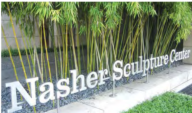
درختان بامبو در اطراف مجموعه

بیش از ۱۷۰ درخت، شامل نارون قرمز، بلوط همیشه سبز (درخت بومی آمریکا و مکزیک)، مورد سبز، بید مجنون، بامبو، راج، ماگنولیا و کاج افغان در این باغ وجود دارد که در ترکیب با یکدیگر و مسیر سنگفرش شده، استخرهای آب و فواره ها به منظر محرمیت داده که باعث ایجاد فضایی آرام