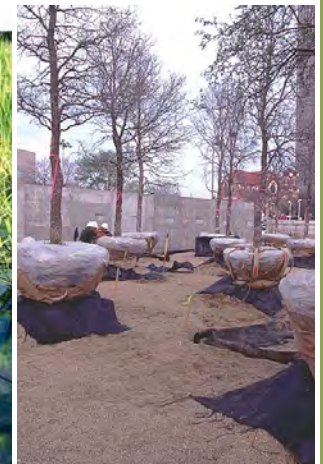
کاشت درختان Cedar Elm در باغ