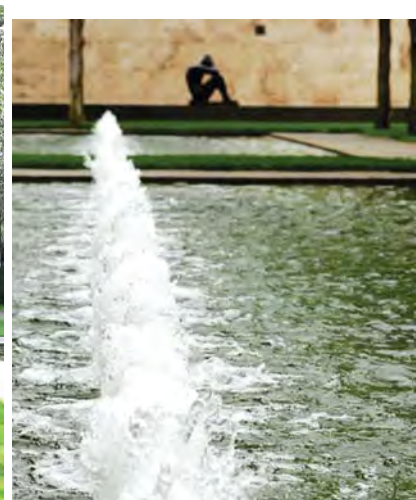
کاشت ردیفی درخت های بلوط و استخر آب در پس زمینه