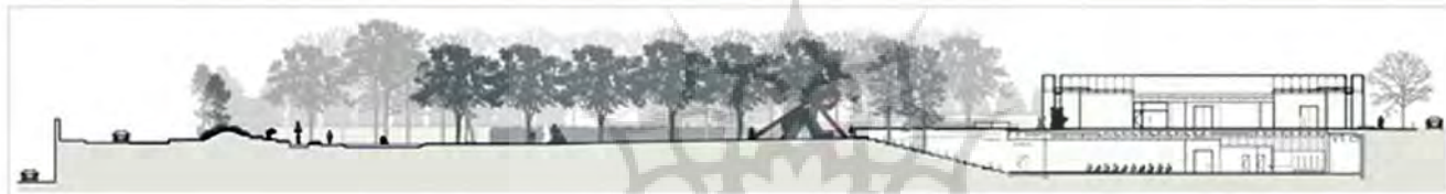
دو برش از باغ در امتداد محور های خیابان ها روود و الو از میان باغ، تراس و دیگری از میان آمفی تئاتر

ظریف بین هنر، فرهنگ و زمینه را در باغ مجسمه مؤسسه «ناشر» نشان می دهد. (www.papress.com) مراسم و رویدادهای مردمی به صورت ماهانه در این مرکز برگزار می شود که شبیه های اول هر ماه به کودکان و خانواده ها اختصاص دارد. همچنین از سخنرانان برجسته جهت مباحثه در حوزه هنر، معماری و موضوعات فرهنگی دعوت به عمل می آید که از میهمانان در فضای باز پذیرایی می شود. این مجموعه از اکتبر سال ۲۰۰۳ تاکنون باز بوده است و یکی از بهترین مجموعه های مجسمه سازی مدرن و معاصر در جهان است. (en.wikipedia.org) این باغ تقریباً ۳۰ قطعه مجسمه را همزمان به صورت استراتژیک در میان منظره سازی زیبای اطراف و فواره ها جای می دهد. چیدمان و نصب مجموعه مجسمه ها متناوباً در باغ و گالری ها تغییر کرده و روح و سرزندگی را به جو آرام این فضای عمومی منحصر به فرد می دهد. (www.nashersculpturecenter.org) به دلیل وزن زیاد بعضی از قطعات و لزوم جابجاکردن مجسمه ها، نوع خاصی از خاک اختراع شده که زه کشی کاملی بدون ایجاد آبگیر دارد و به اندازه کافی قدرت دارد تا نیروی وزن هرگونه مجسمه ای را تحمل کند.