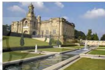
باغ مغول - آبراه اصلی دید به آبراه اصلی و تالار کارت رایت