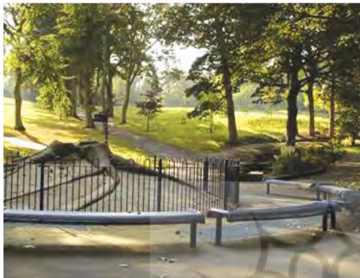
کنده درخت فسیل مانند و ساعت زمین شناسی