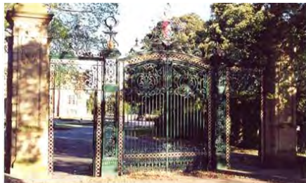
ورودی مجموعه - بازگرداندن دروازه های قدیمی به حالت اولیه

طرح این بخش، از طرحهای رایج سلسله مغول که هم اکنون پاکستان و شمال هند را شامل می شود الهام گرفته است (۱۵۲۶-۱۸۵۸). طرح بر آبروی مرکزی برجسته که لبه های آنرا توده درختان تشکیل می دهد، تاکید دارد. تعدادی استخر کوچک مستطیل شکل با زوایای قائمه و فواره های جوشان از آبروی اصلی منشعب می شوند. این مجموعه به یک حوض دایره ای شکل با فواره ای در میان آن منتهی می شود.