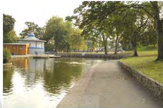
دریاچه قایقرانی - دید به سمت کافه تریای جدید

دو اولویتی که از مشاوره با مردم بدست آمد، این بود که مردم می خواستند دریاچه قایقرانی احیاء شود و قایق‌ها بدان بازگردانده شوند. همچنین آنها خواستار آن بودند که امنیت بیشتری را احساس کنند که با افزایش قابلیت دید و نظارت رسمی و اتفاقی به قسمت‌های مختلف پارک تامین می شود. اینها عواملی هستند که عناصر مهم فاز اول احیاء پارک را شکل داده اند.