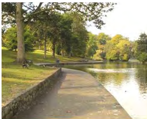
تورنمای دریاچه قایقرانی

هدف اولیه تیم طراحی ایجاد تعادل میان بخشهای میراثی و تاریخی به عنوان جاذب سرمایه بوده است همچنین این پارک باید بتواند نیازهای استفاده کنندگان آن را نه تنها در محدوده مینینگهام بلکه در کل شهر برادفورد تامین کند.