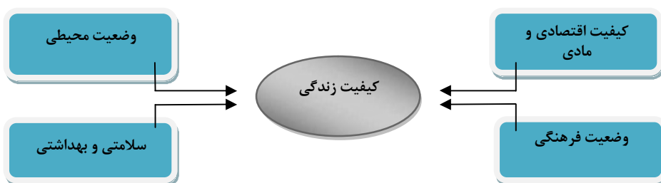
شکل شماره ۱. مدل نظری سنجش کیفیت زندگی شهری پژوهش