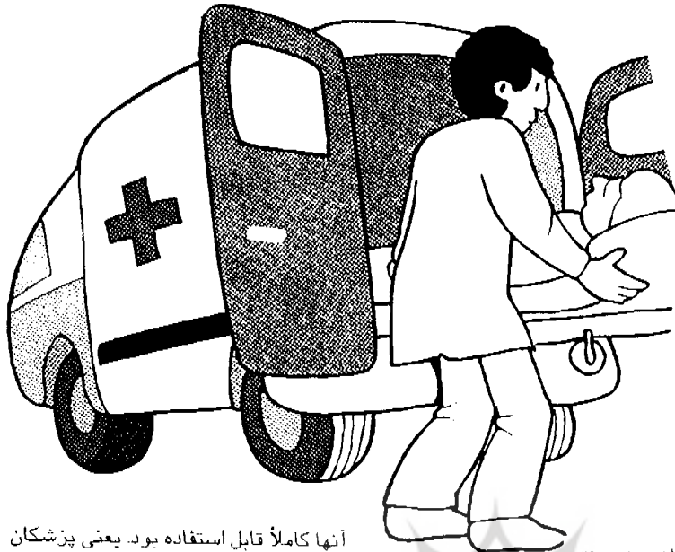
بقیه از صفحه ۷۲

ضمناً تعداد ۲۲ قلم کالای مشمول مقررات استاندارد اجباری جهت واردات اعلام گردیده که در بین آنها لوازم و قطعات برقی و صنعتی نخ و منسوجات به چشم می‌خورد.