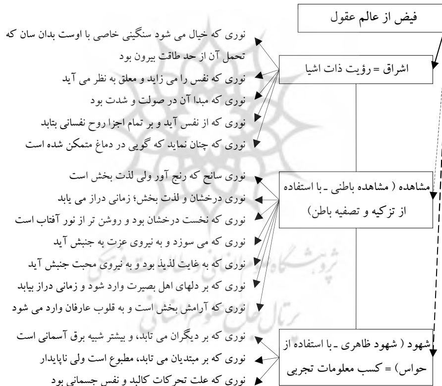
شکل شماره ۱: فرایند حصول معرفت اشراقی (علم اشراق)

خود باز گرد تا این مسئله برای حل شود" (خادم جهرمی، ۱۳۸۵: ۱۶۴). نصیحت ارسطو به سهروردی در واقع این است که برای شناختن هر چیز (علم به هر چیز) شخص باید اول «خود» را بشناسد. این شناخت، که به نظر سهروردی هم در سطح عملی و هم در سطح نظری، درونمایه ای را برای فرد فراهم می کند، که در گستره اشراق ظهور و بروز می یابد و به عقیده سهروردی در همین فرایند معرفت شناسی است که شخص پانزده نوع نور را در یک فرایند سه مرحله ای شهود، مشاهده و اشراق تجربه می کند (شکل شماره ۱).