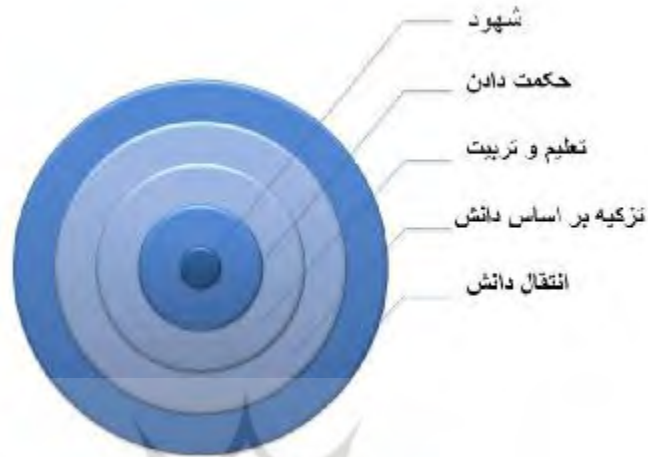
شکل ۱: مراحل ترتیبی نسبت پنج مقوله مورد بحث در آیه ۱۵۱ بقره از ساده و فراگیر به پیچیده و خاص