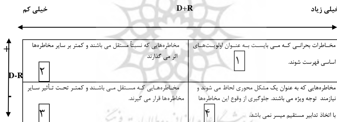
شکل شماره (۱): مدل شماتیک دیاگرام علت و معلولی

پس از انجام محاسبات روش دیماتل و به دست آوردن مقادیر D و R، به منظور تجزیه و تحلیل دقیق‌تر از ماهیت مخاطرات در سیستم زنجیره تأمین مدل شماتیک شکل شماره ۱ طراحی شد.